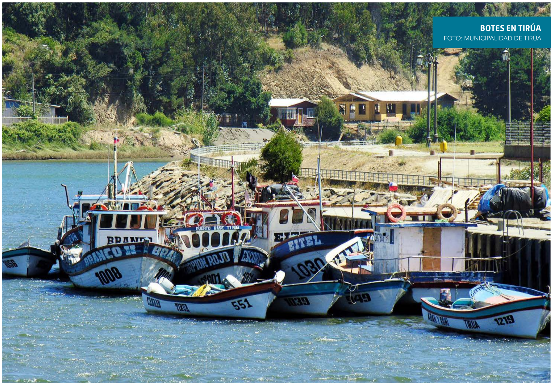
BOTES EN TIRÚA