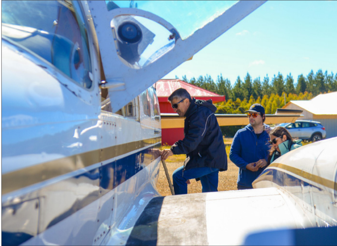
FOTO: SERVICIO AÉREO SUBSIDIADO A ISLA MOCHA

CONEXIÓN AÉREA ES CLAVE EN EMERGENCIAS MÉDICAS