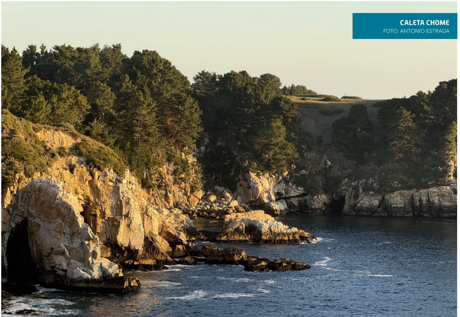
CALETA CHOME