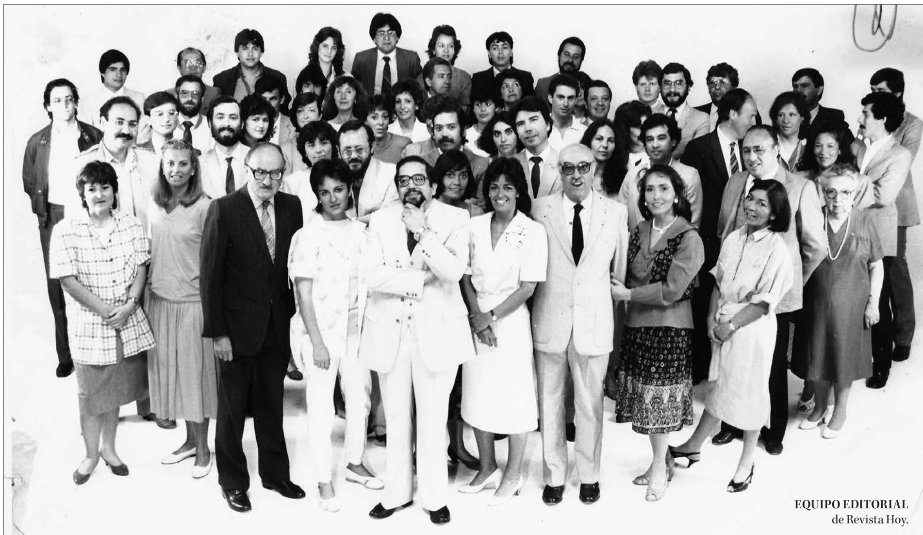
EQUIPO EDITORIAL de Revista Hoy.

X @MediosUdeC contacto@diarioconcepcion.cl