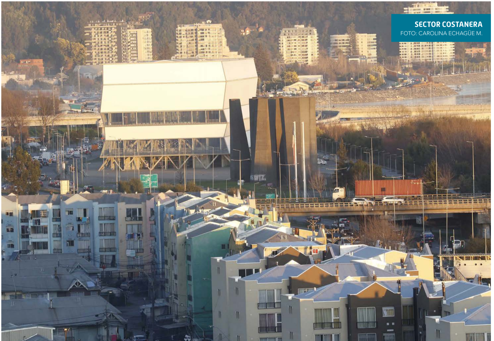
SECTOR COSTANERA