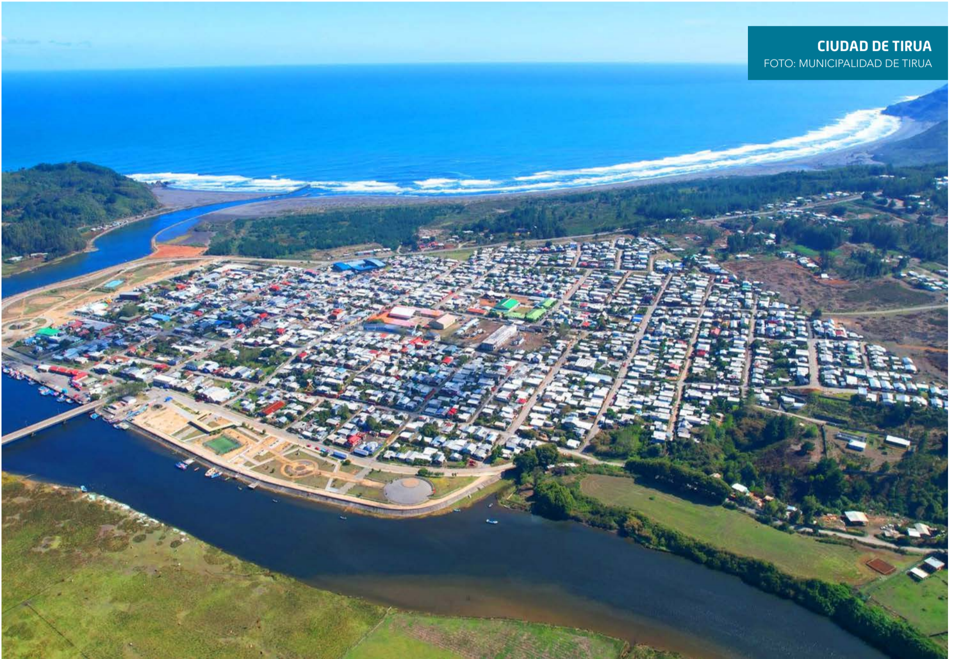
CIUDAD DE TIRUA