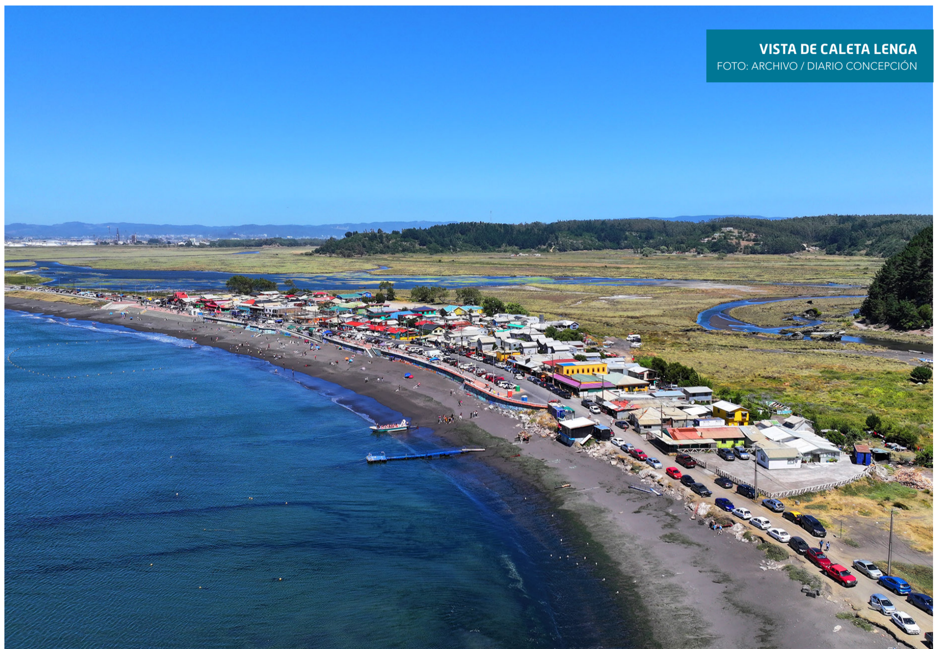
VISTA DE CALETA LENGUA