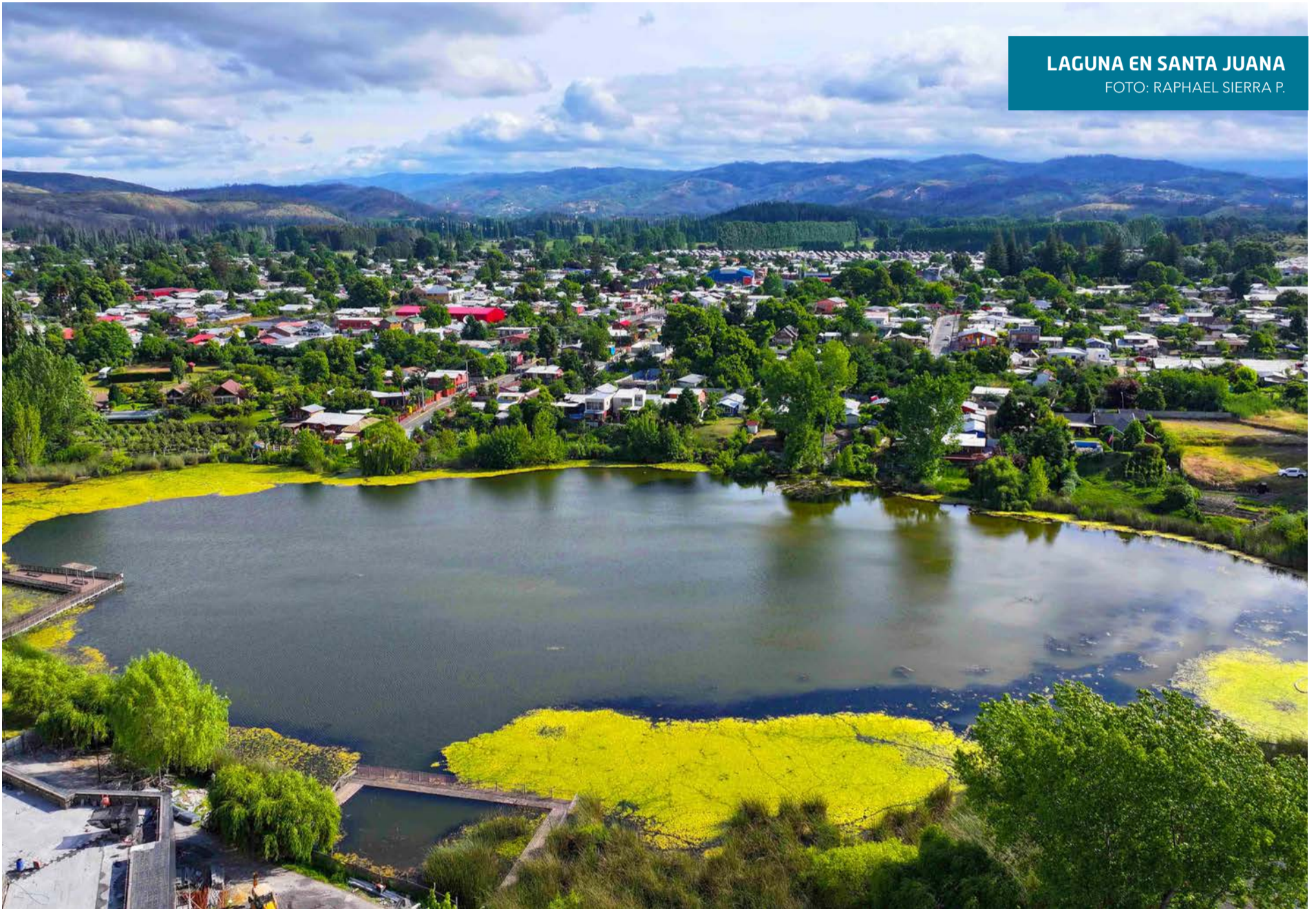
LAGUNA EN SANTA JUANA