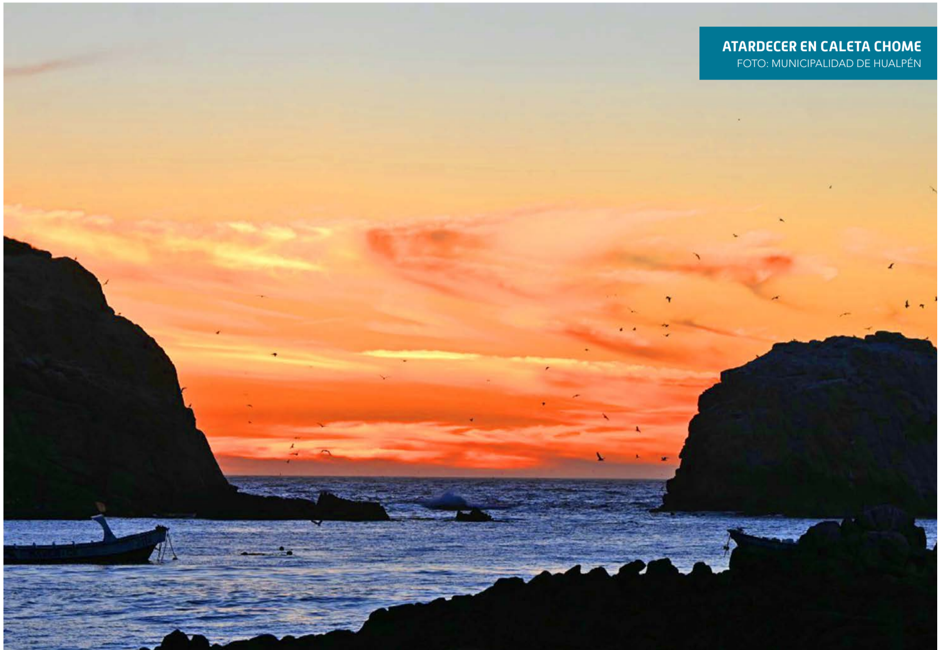
ATARDECER EN CALETA CHOME