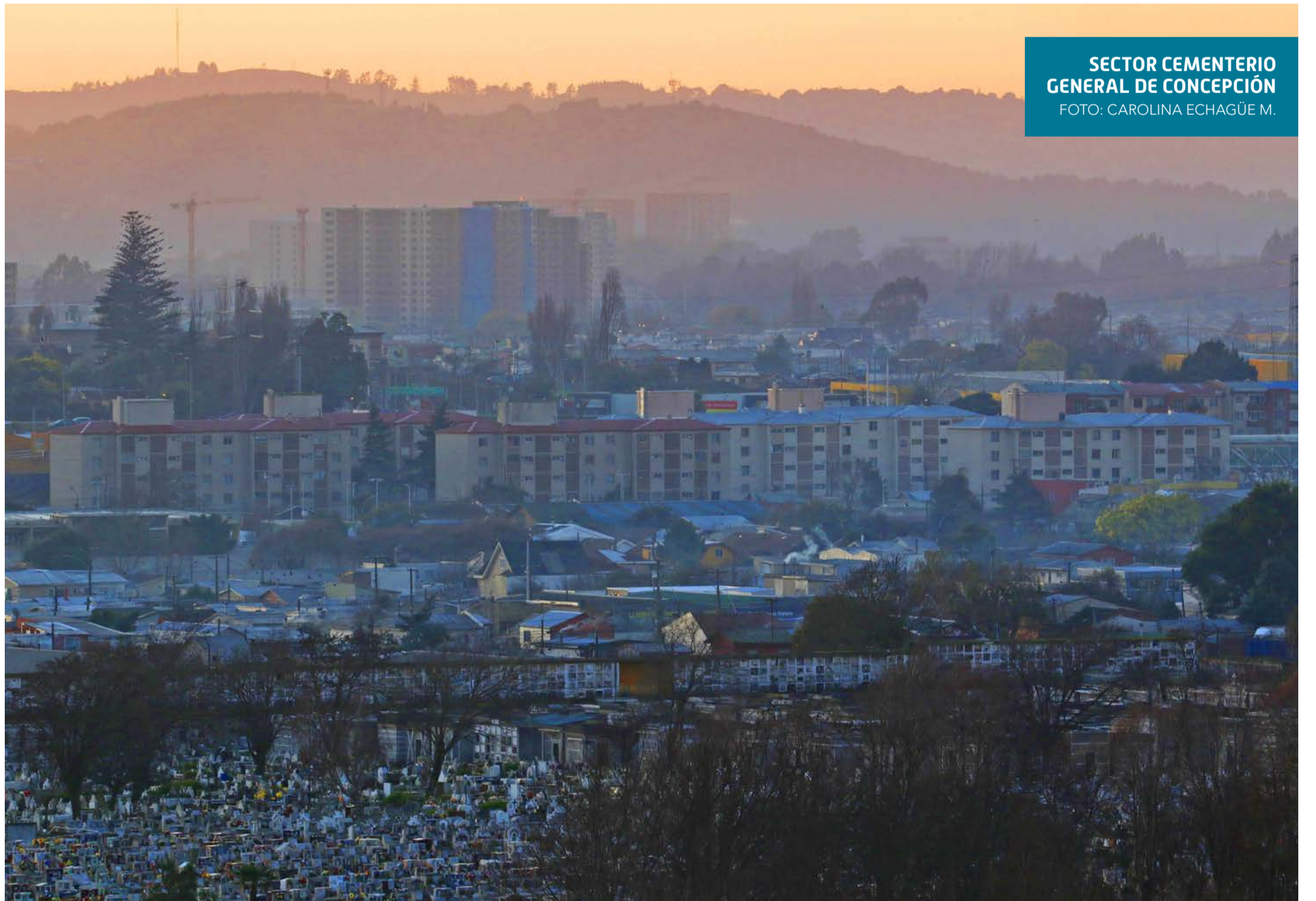
SECTOR CEMENTERIO GENERAL DE CONCEPCIÓN