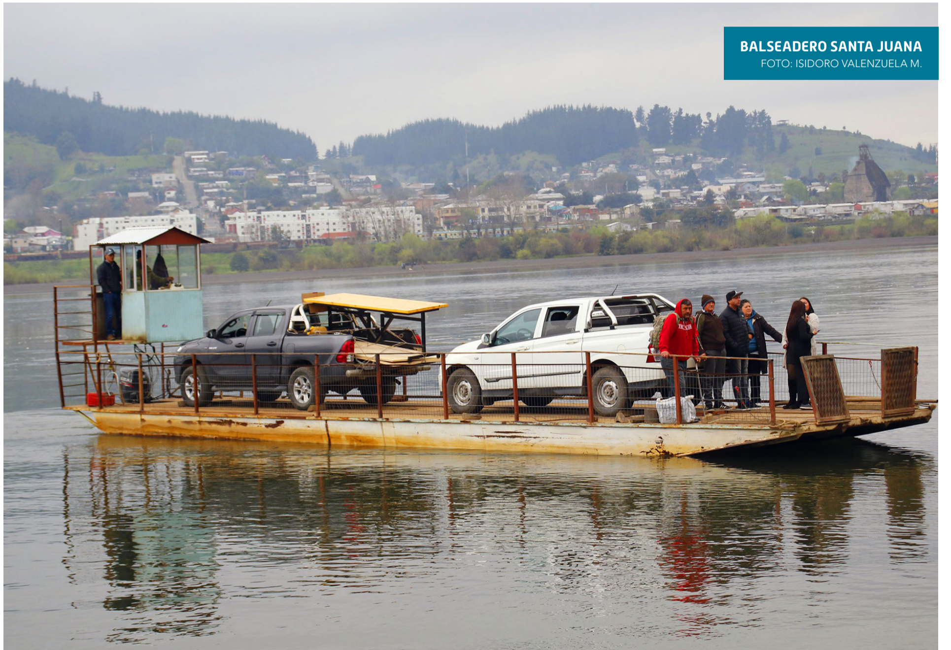
BALSEADERO SANTA JUANA