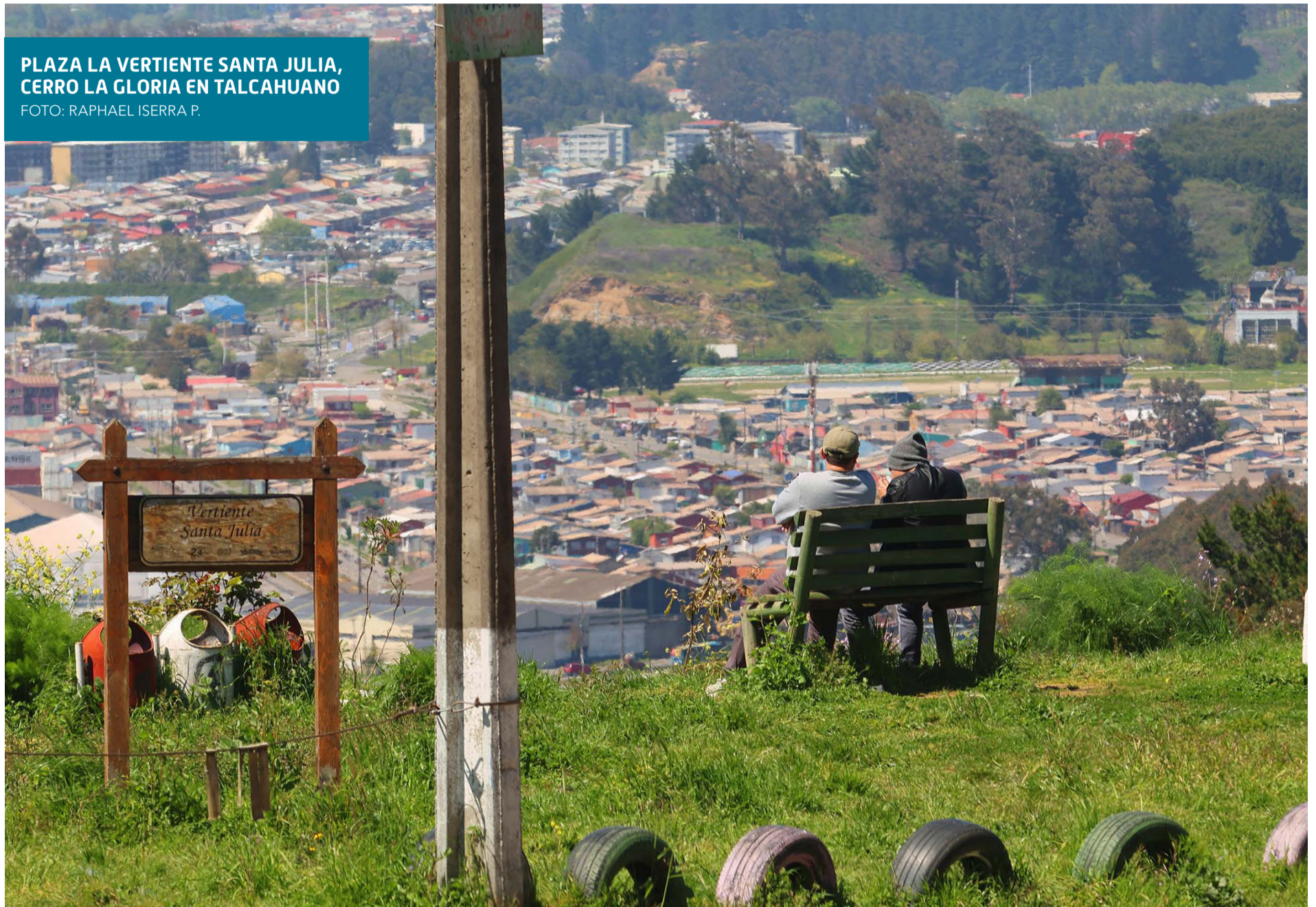
PLAZA LA VERTIENTE SANTA JULIA, CERRO LA GLORIA EN TALCAHUANO