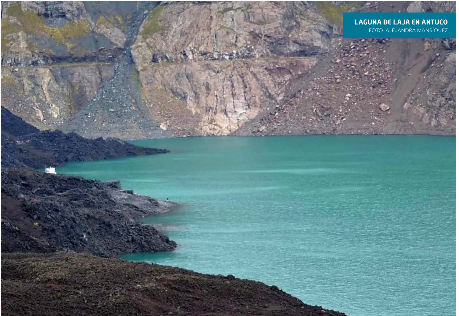
LAGUNA DE LAJA EN ANTUCO