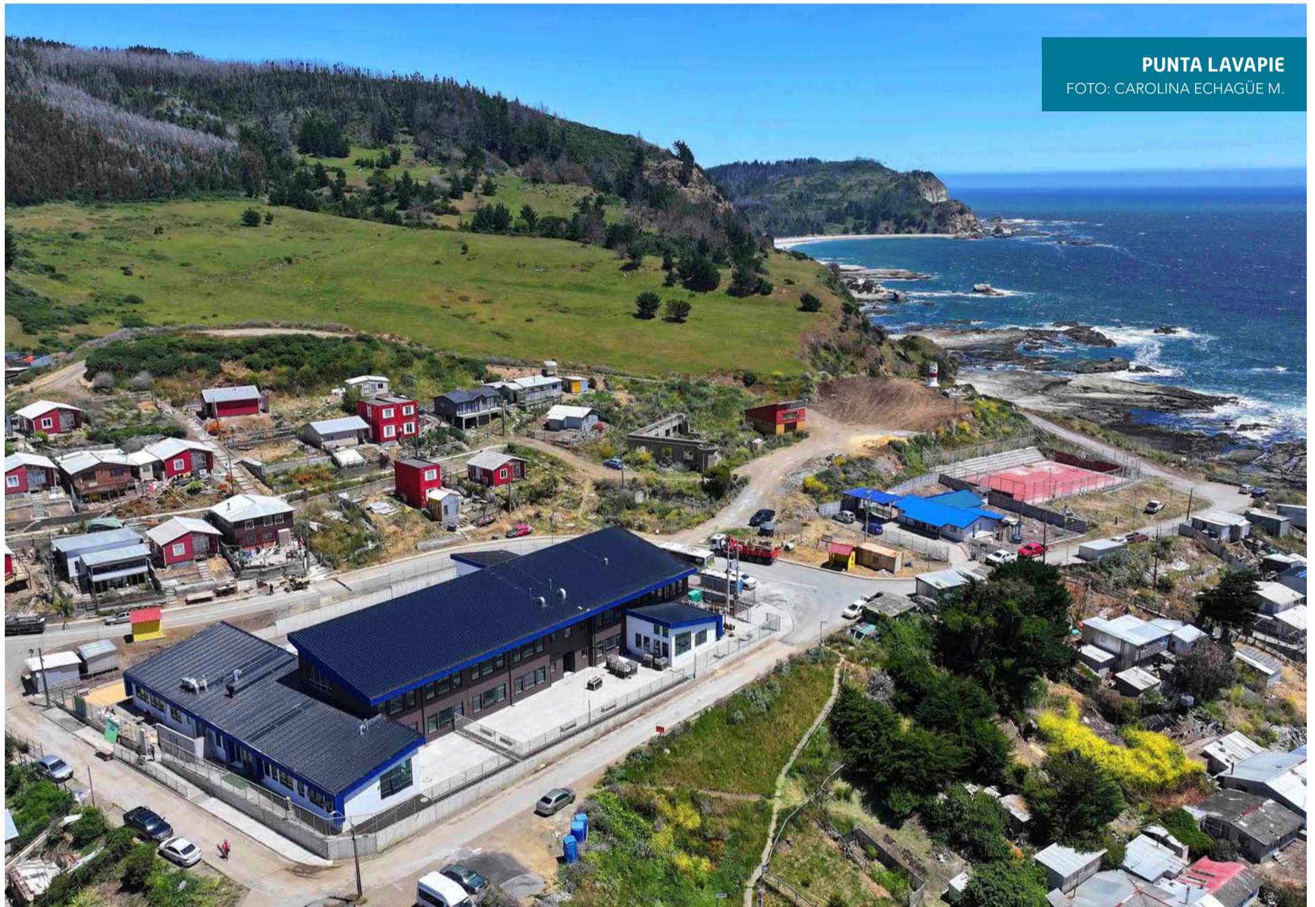
PUNTA LAVAPIE