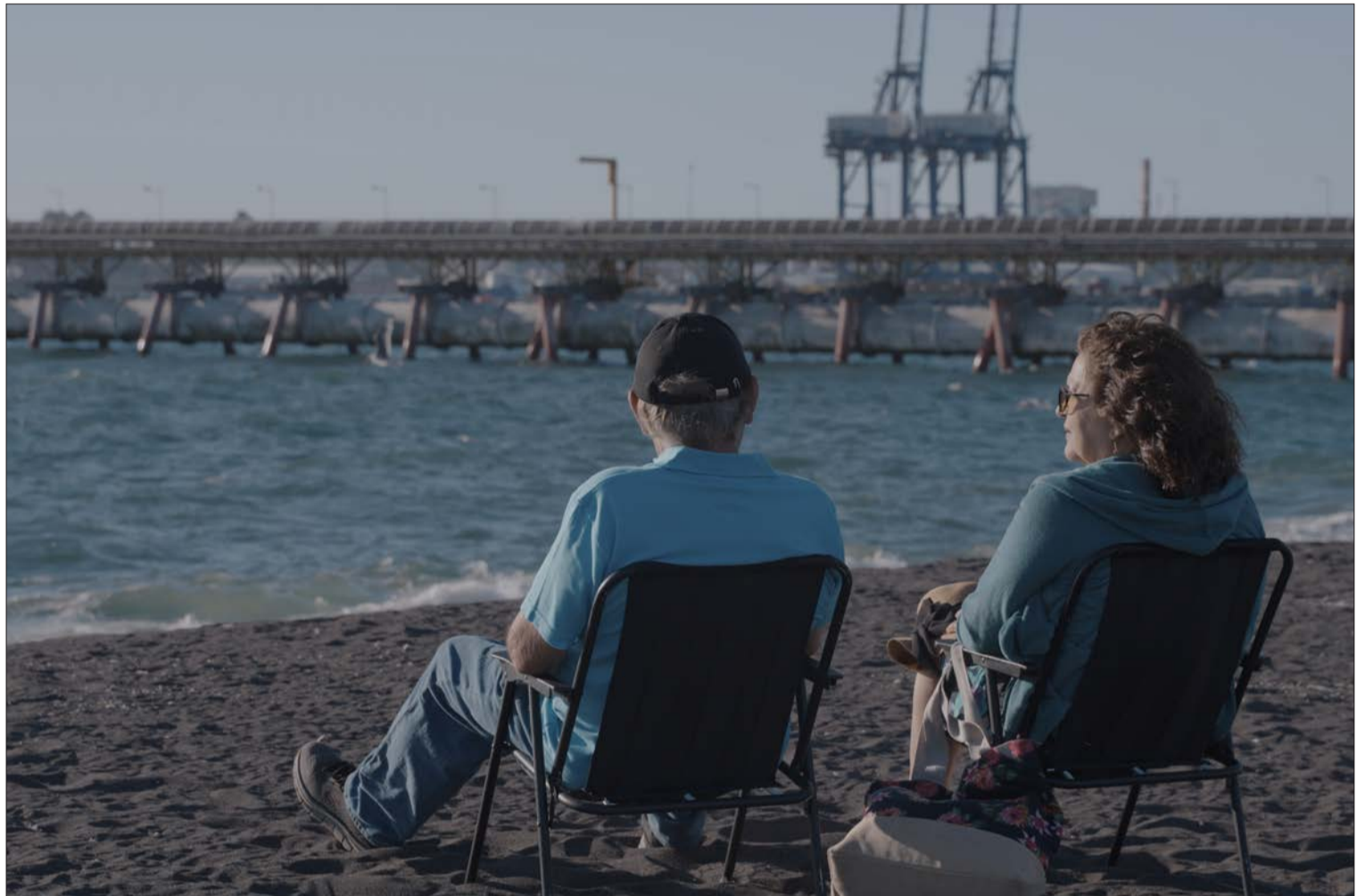
DETRÁS DE LAS INDUSTRIAS SE ESCONDE EL SOL

"La obra se aleja de la retórica tradicional de la denuncia para sumergirse en una estética poética y ficcional. No sólo documenta un territorio en crisis, sino que captura el nacimiento de un imaginario especulativo colectivo. Es un ejercicio de justicia a través de la ficción donde la cámara no sólo observa lo que es, sino que proyec-