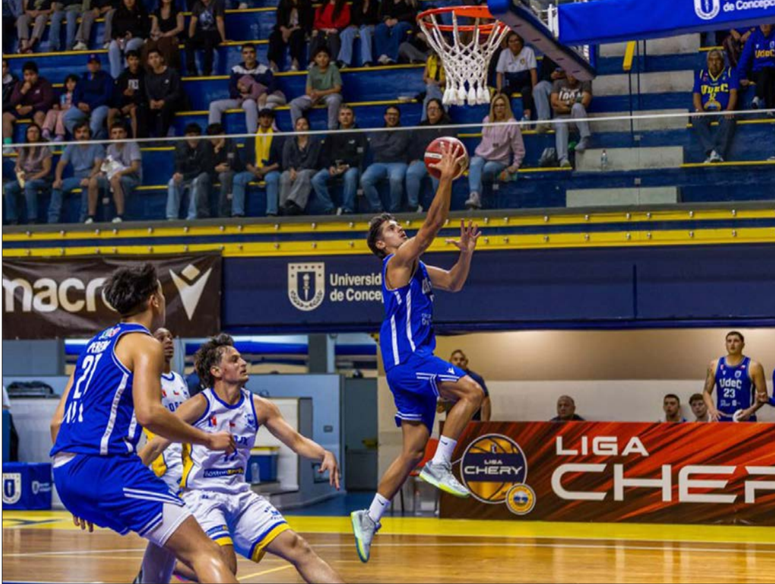
DOBLE JORNADA EN SANTIAGO