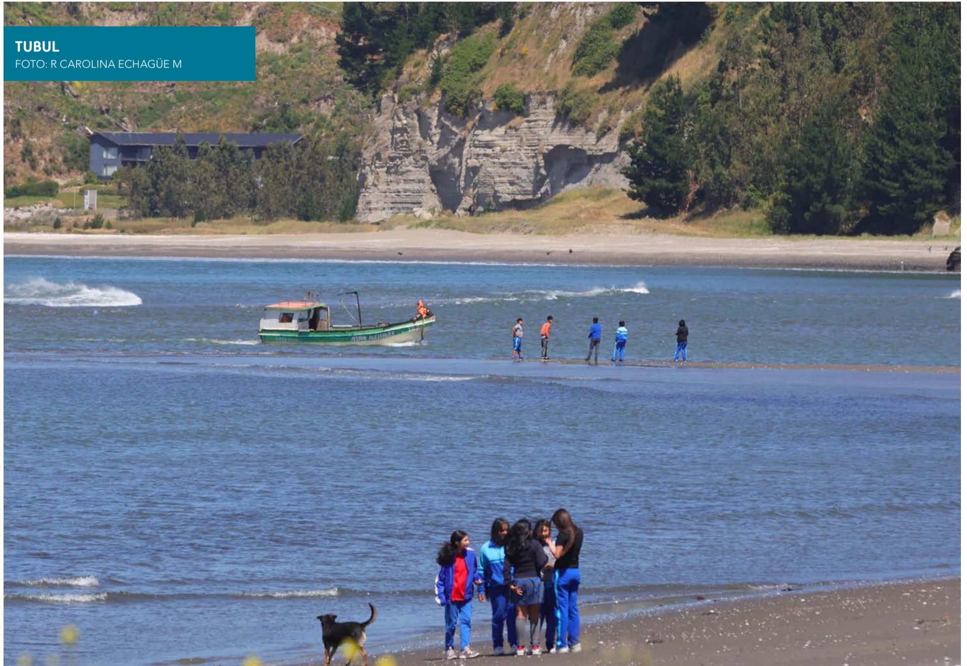
TUBUL FOTO: R CAROLINA ECHAGÜE M