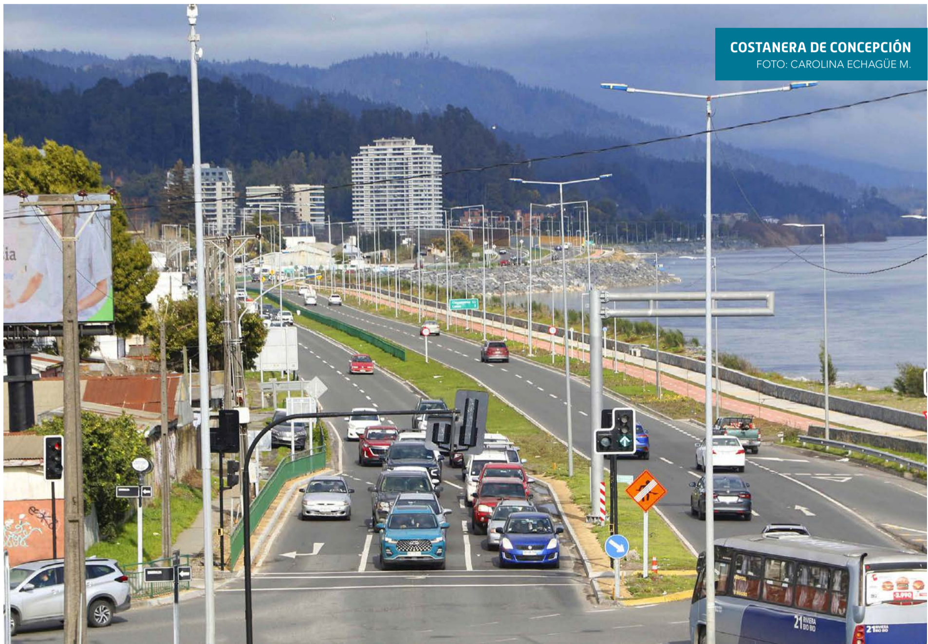
COSTANERA DE CONCEPCIÓN