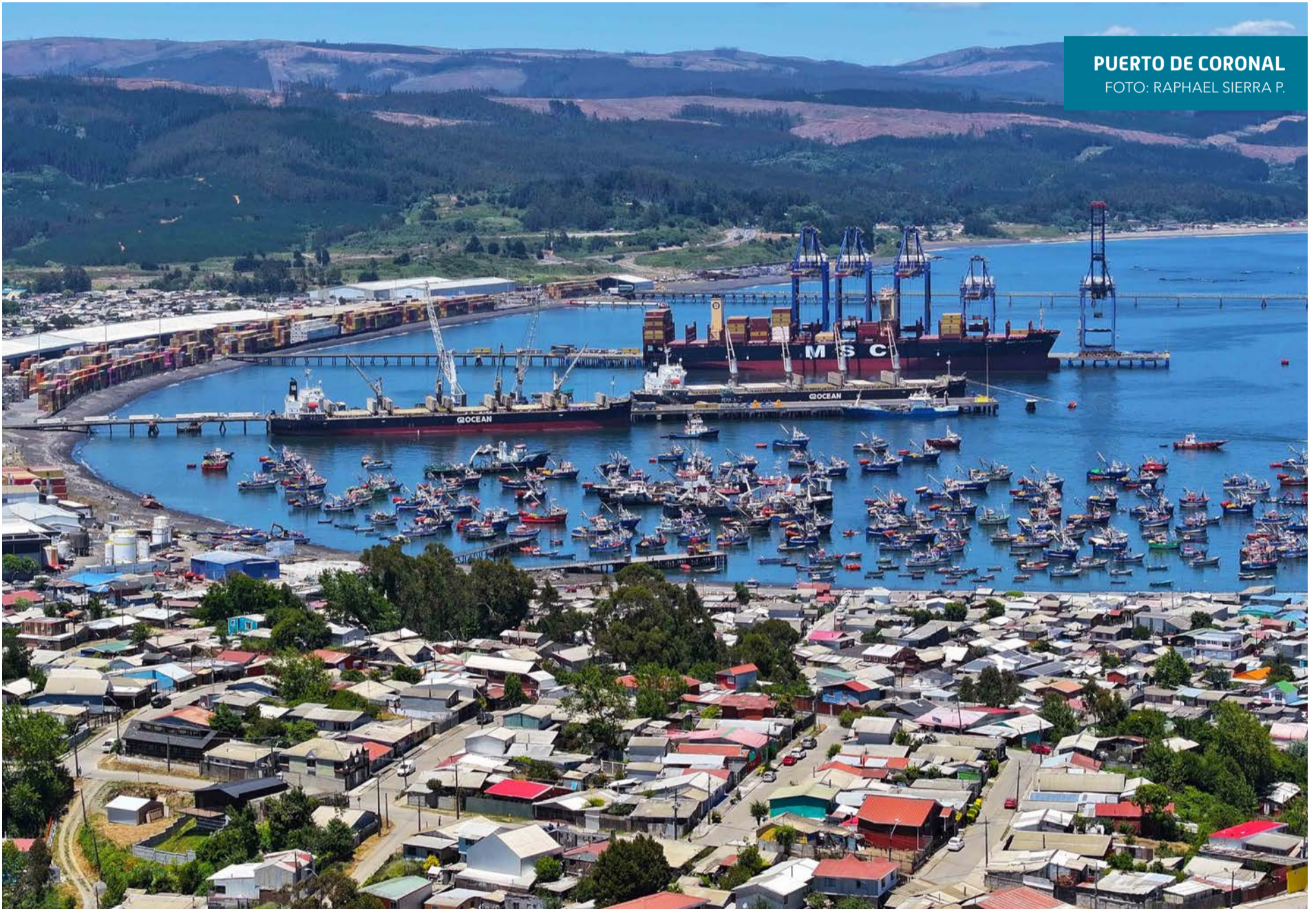
PUERTO DE CORONAL