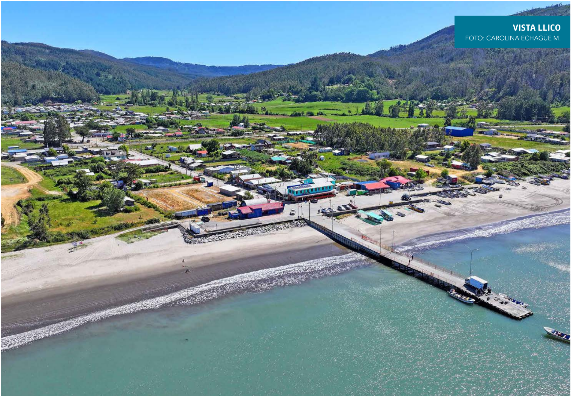
VISTA LLICO