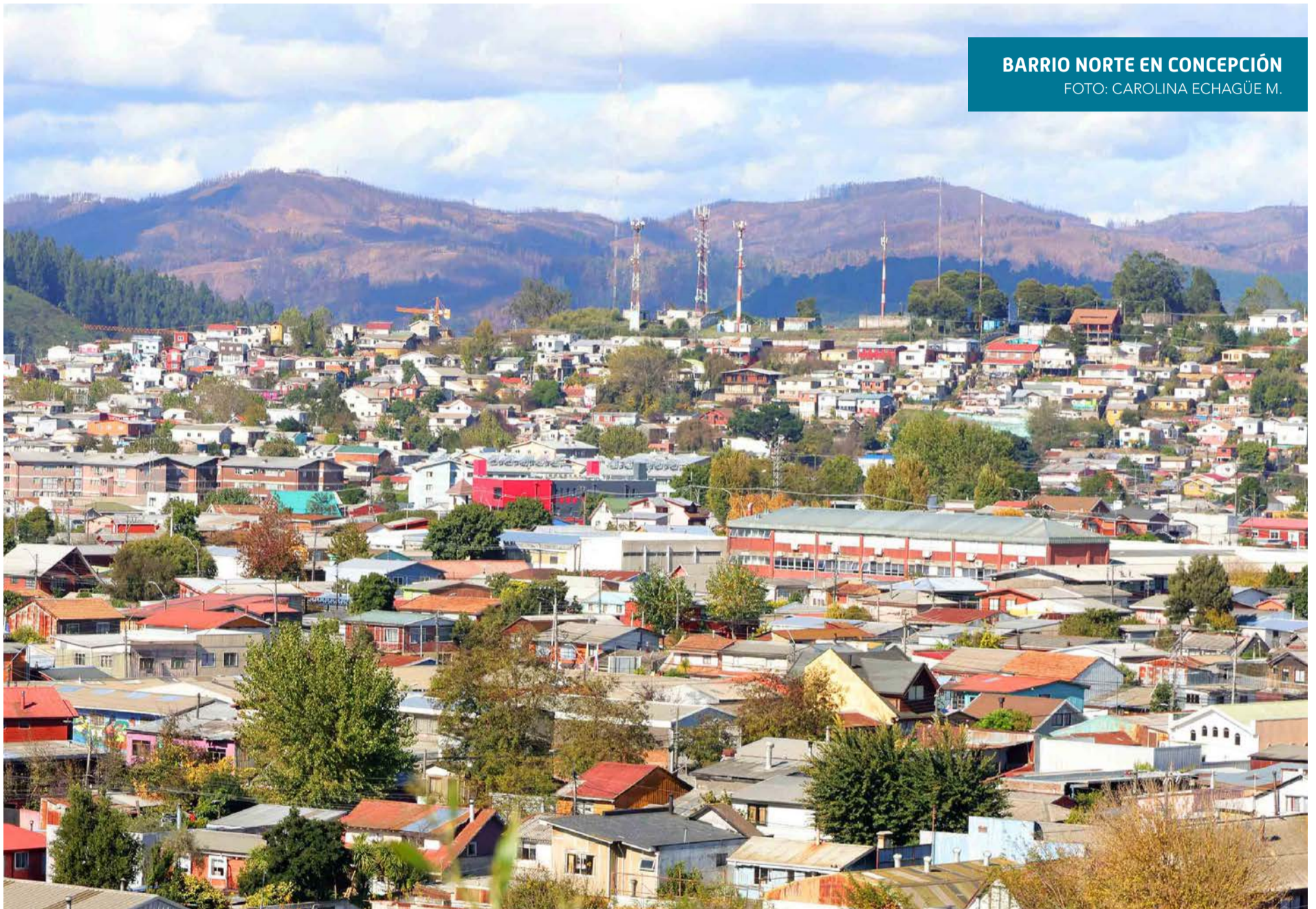
BARRIO NORTE EN CONCEPCIÓN