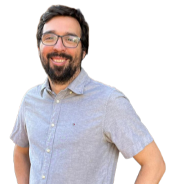
Álvaro Paredes Data Observatory

to tangible, y por sobre todo, lograr que diferentes conjuntos de datos (o silos), logren ser interoperables.