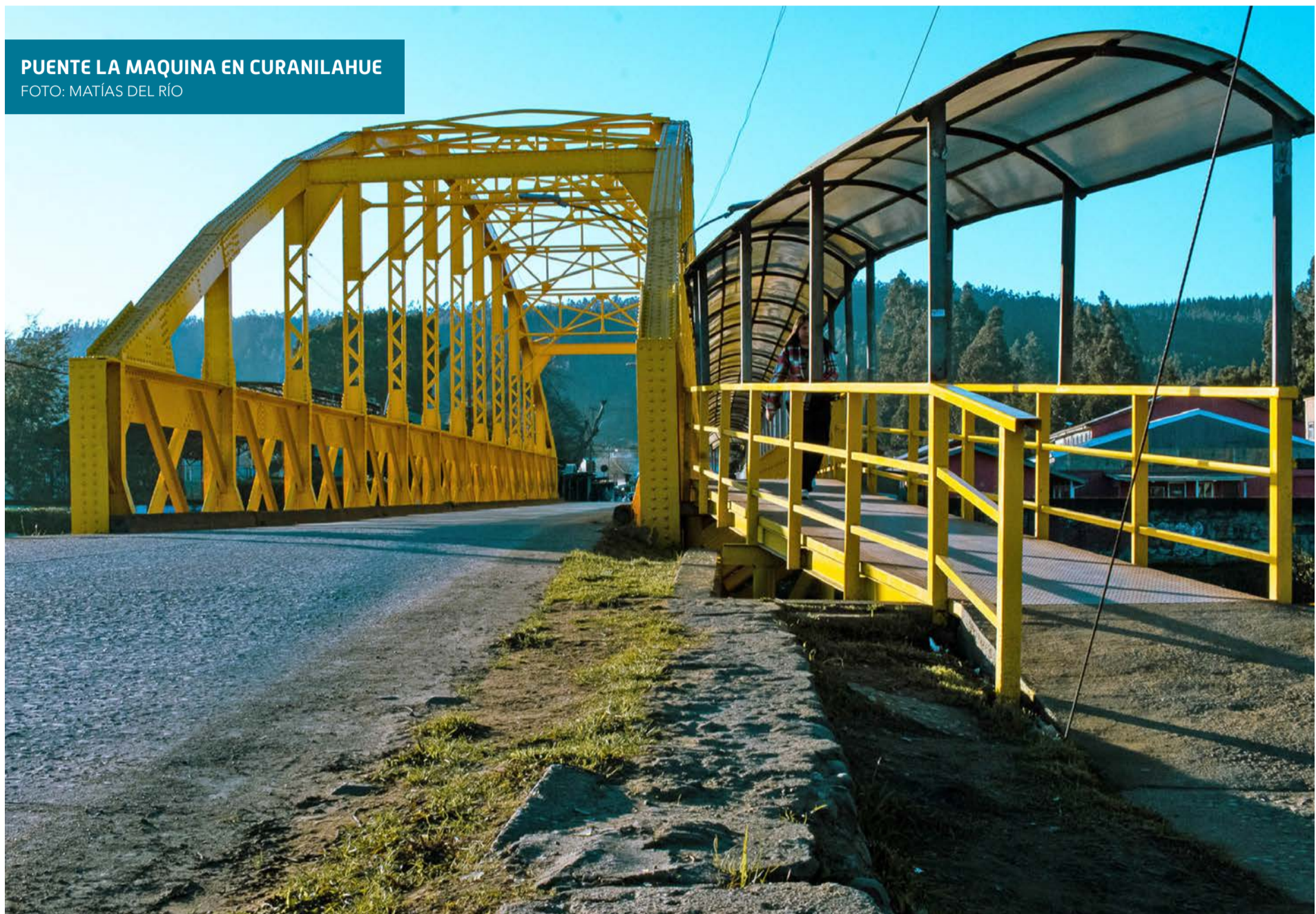
PUENTE LA MAQUINA EN CURANILAHUE