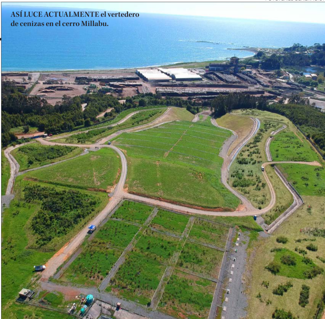
ASÍ LUCE ACTUALMENTE el vertedero de cenizas en el cerro Millabu.

Las otras siete sí cuentan con RCA —entre ellas Bocamina II en Coronel—, pero, según la denuncia, no habrían ejecutado compromisos explícitos de cierre, como la presentación de planes de abandono, la cobertura de vertederos de cenizas, el monitoreo post cierre o la restauración ambiental de los sitios intervenidos.