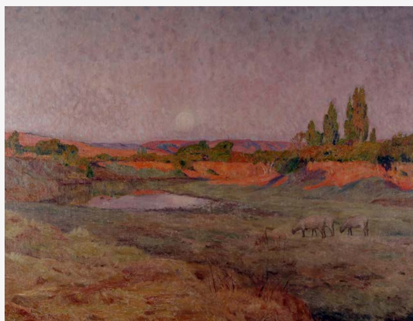
Paisaje crepuscular, Alberto Valenzuela Llanos

A lo largo de casi siete décadas, la Colección Pinacoteca UdeC ha conformado un acervo diverso que incluye pinturas, grabados, acuarelas, dibujos y esculturas, con especial énfasis en el conjunto de obras de la Generación del 13. Su desarrollo da cuenta de un trabajo sistemático de conservación, investigación y proyección, que permite articular un relato cronológico y temático de la pintura chilena desde el período colonial hasta la