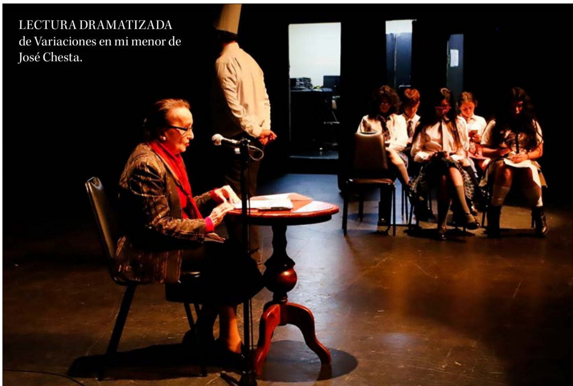
LECTURA DRAMATIZADA de Variaciones en mi menor de José Chesta.

Esta conmemoración resaltó el valor del teatro universitario como parte constitutiva de la identidad cultural de la UdeC.