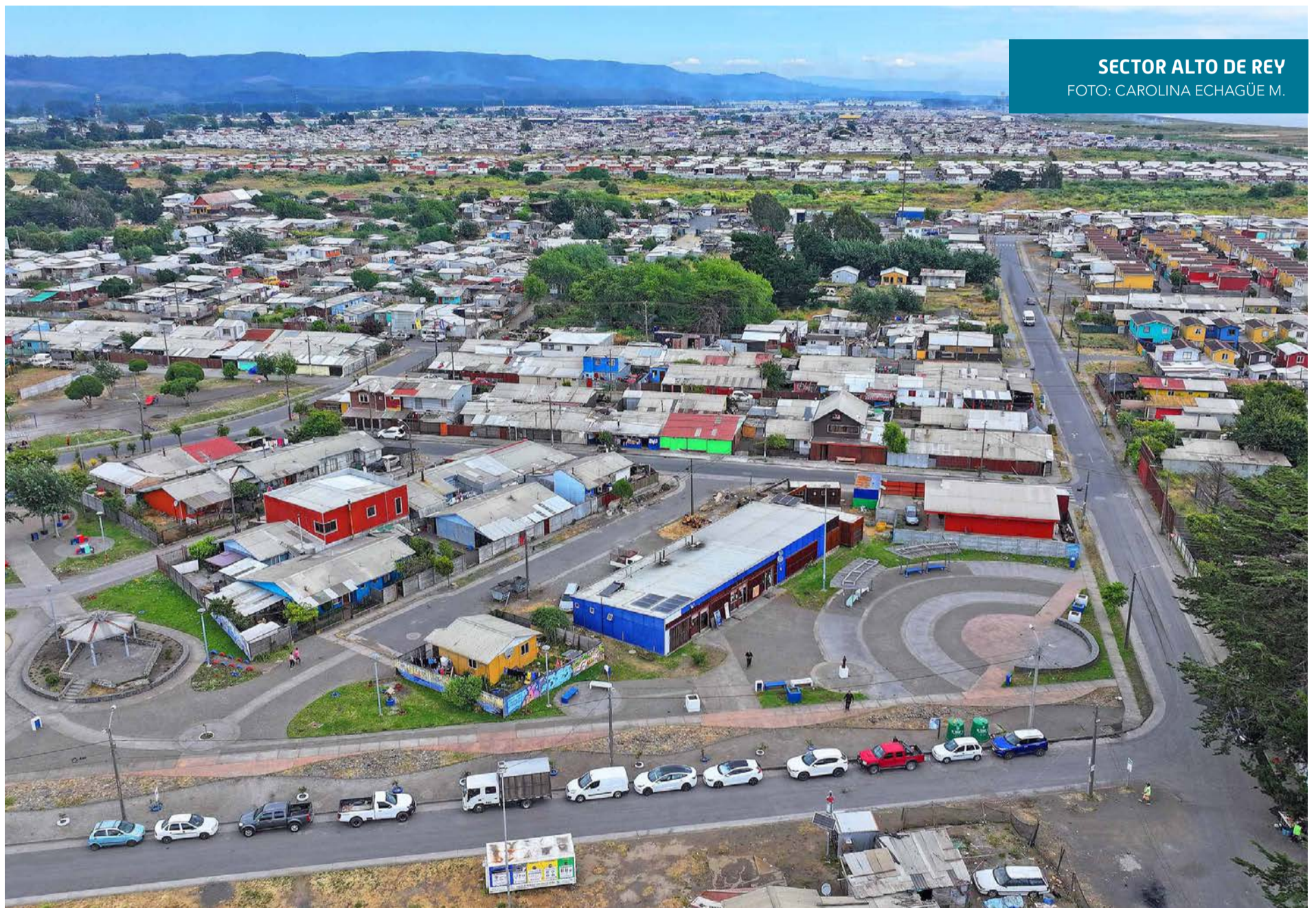
SECTOR ALTO DE REY