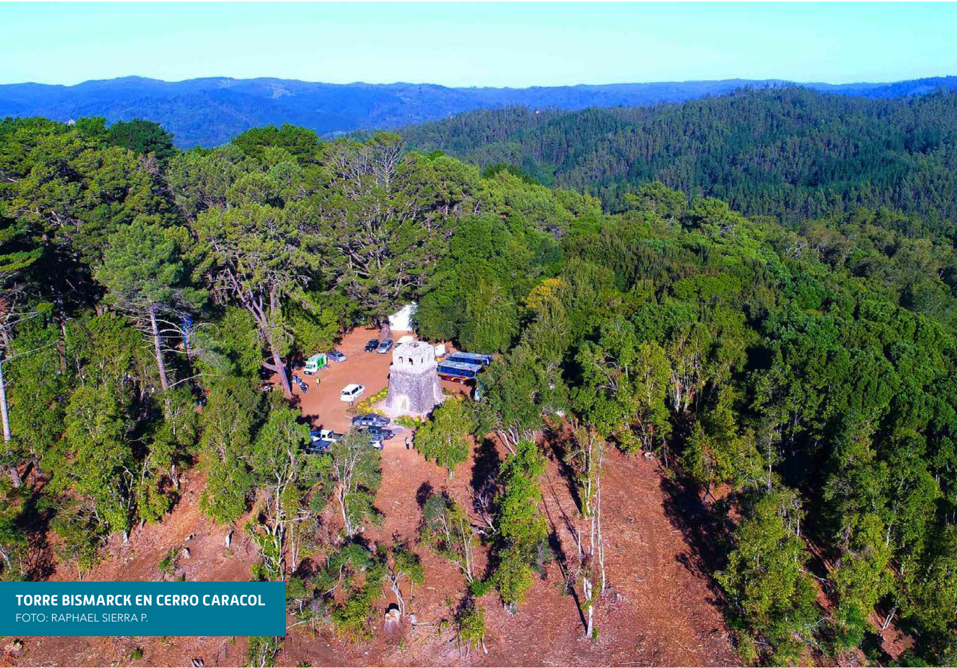
TORRE BISMARCK EN CERRO CARACOL