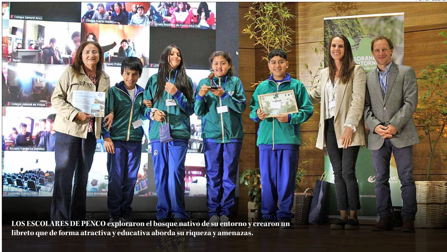
LOS ESCOLARES DE PENCO exploraron el bosque nativo de su entorno y crearon un librito que de forma atractiva y educativa aborda su riqueza y amenazas.

Y el impacto trasciende a ganar. “Más allá de competir, participar es una experiencia que marca a estudiantes y docentes: el programa invita a aprender haciendo, a trabajar en equipo y a mirar el territorio con otros ojos”, sostuvo.