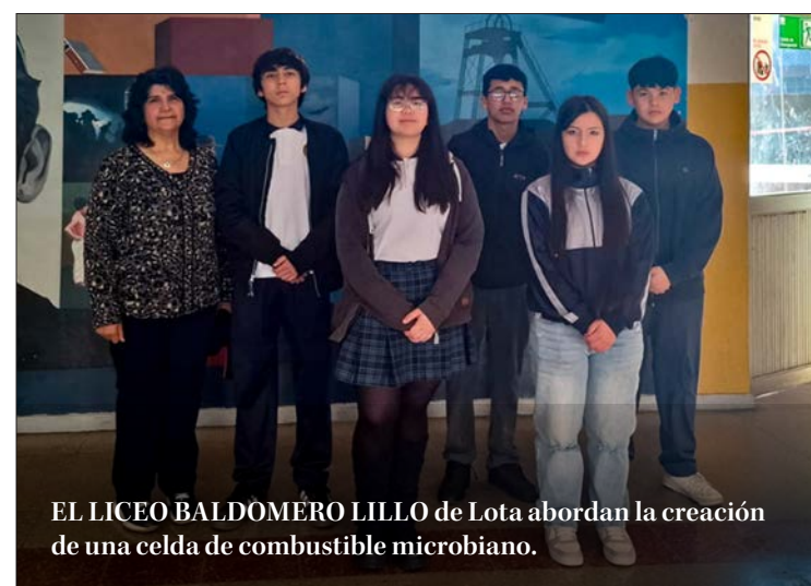
EL LICEO BALDOMERO LILLO de Lota abordan la creación de una celda de combustible microbiano.

Twitter @DiarioConce contacto@diarioconcepcion.cl