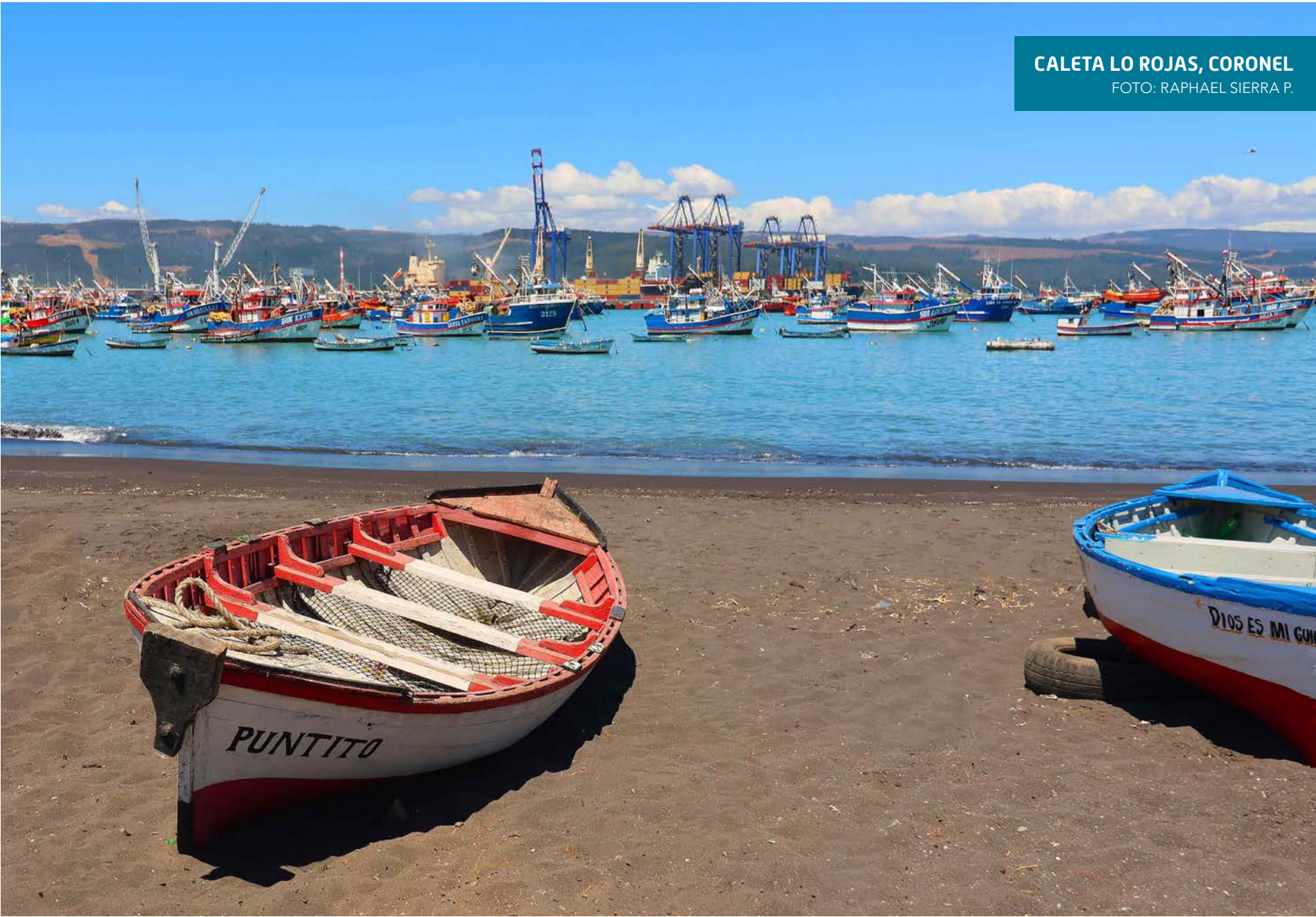
CALETA LO ROJAS, CORONEL