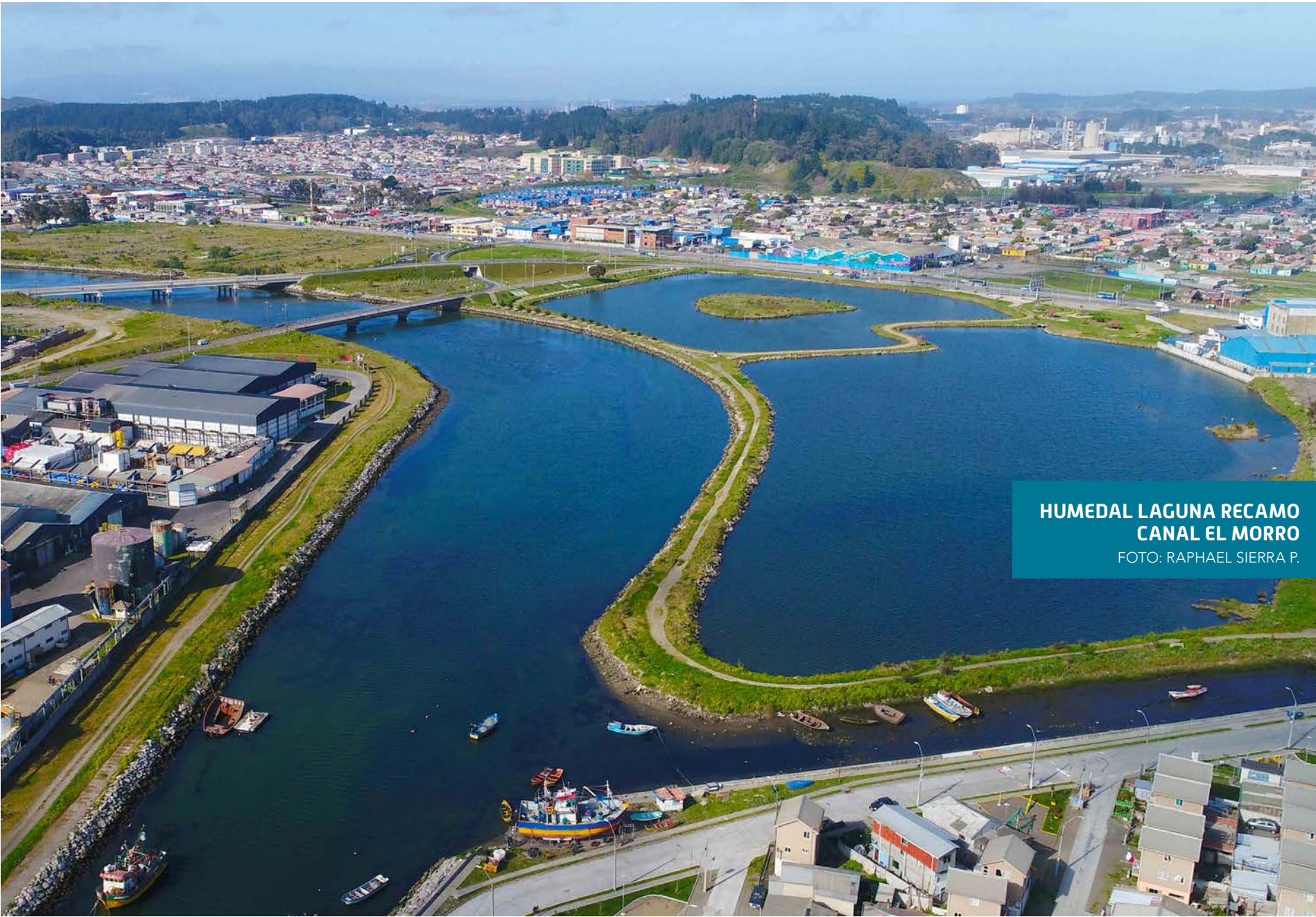
HUMEDAL LAGUNA RECAMO CANAL EL MORRO