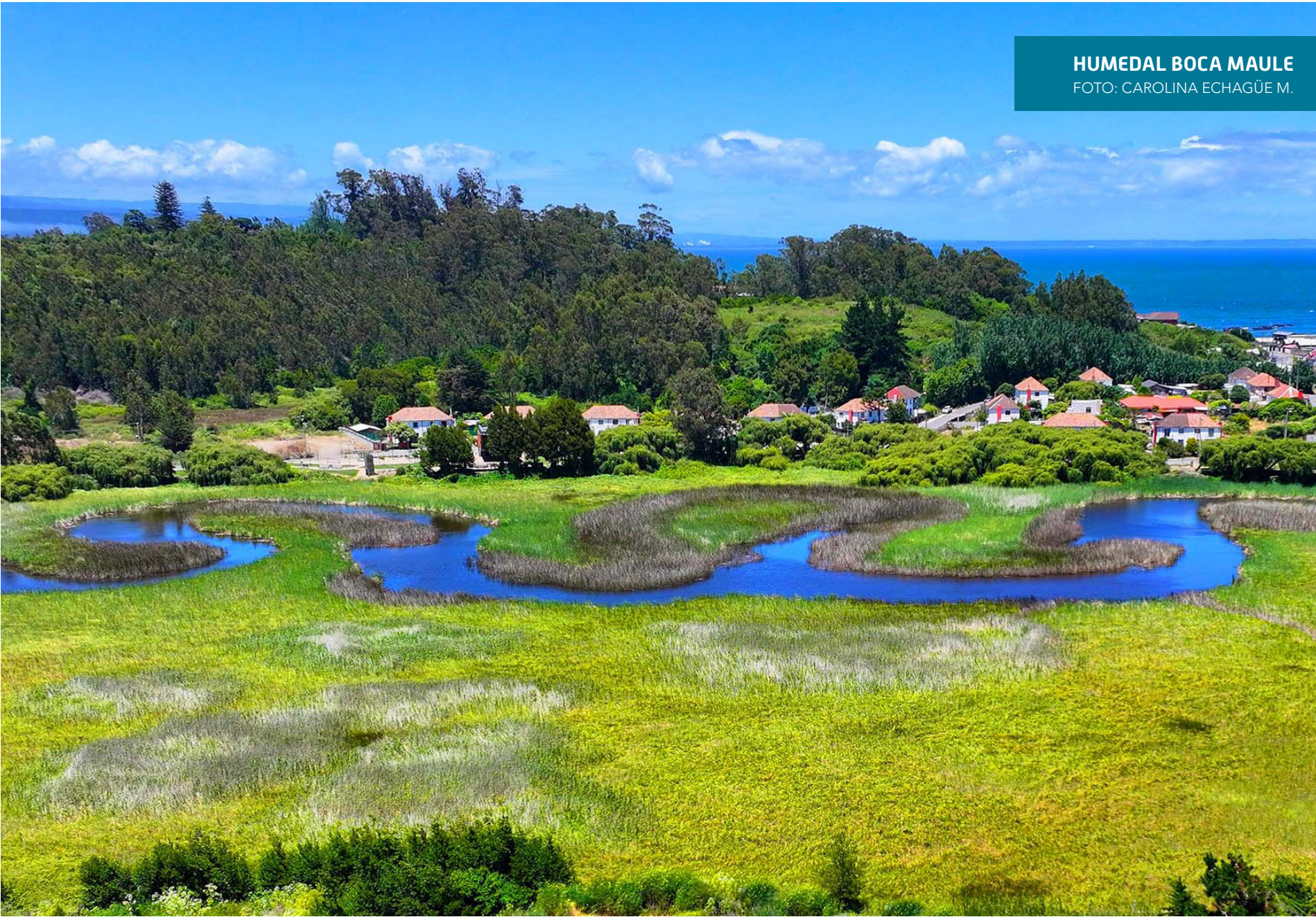
HUMEDAL BOCA MAULE