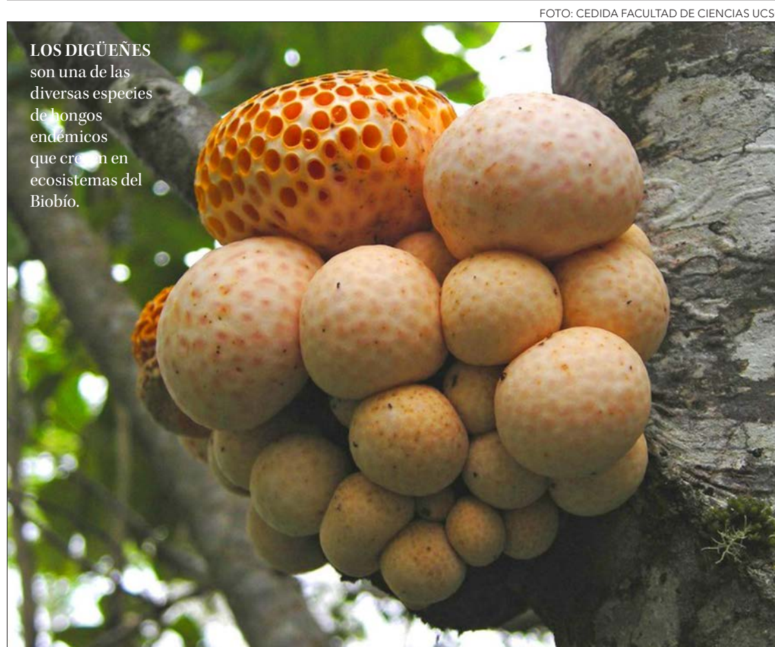
LOS DIGÜEÑES son una de las diversas especies de hongos endémicos que crecen en ecosistemas del Biobío.

La Región posee características que genera que haya gran diversidad de hongos, de alto valor ecológico y sociocultural, aunque hay brechas de evidencias y herramientas científicas que pueden perjudicar su comprensión y preservación, mientras avanzan diversas amenazas ambientales.