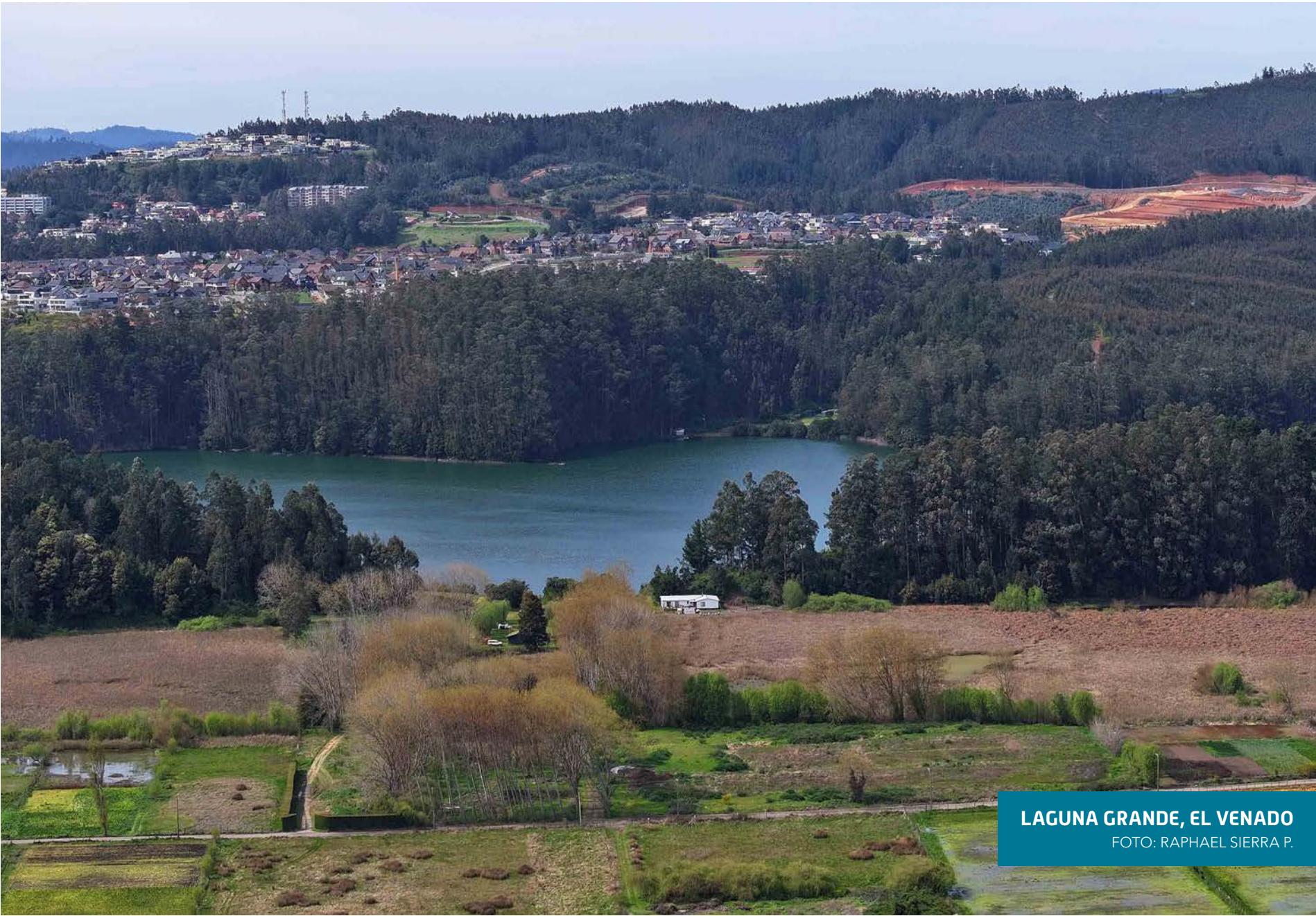
LAGUNA GRANDE, EL VENADO