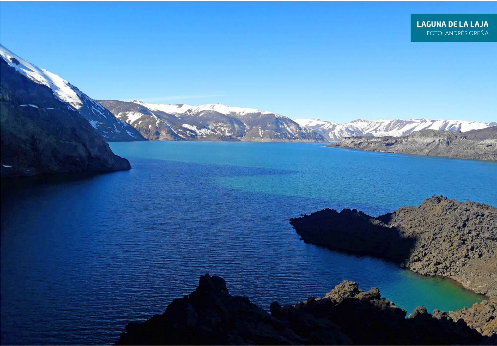
LAGUNA DE LA LAJA