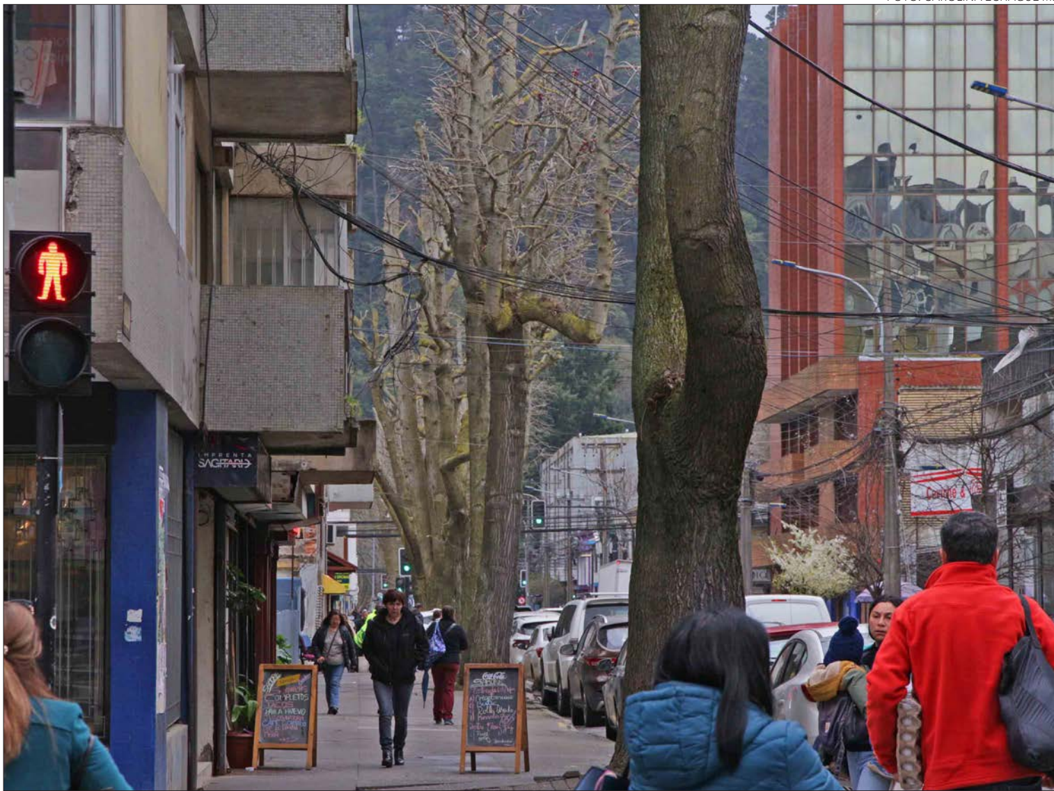
CUADRANTE DE CALLES ALBERTO HURTADO, PARQUE ECUADOR, ROOSEVELT Y LOS CARRERA