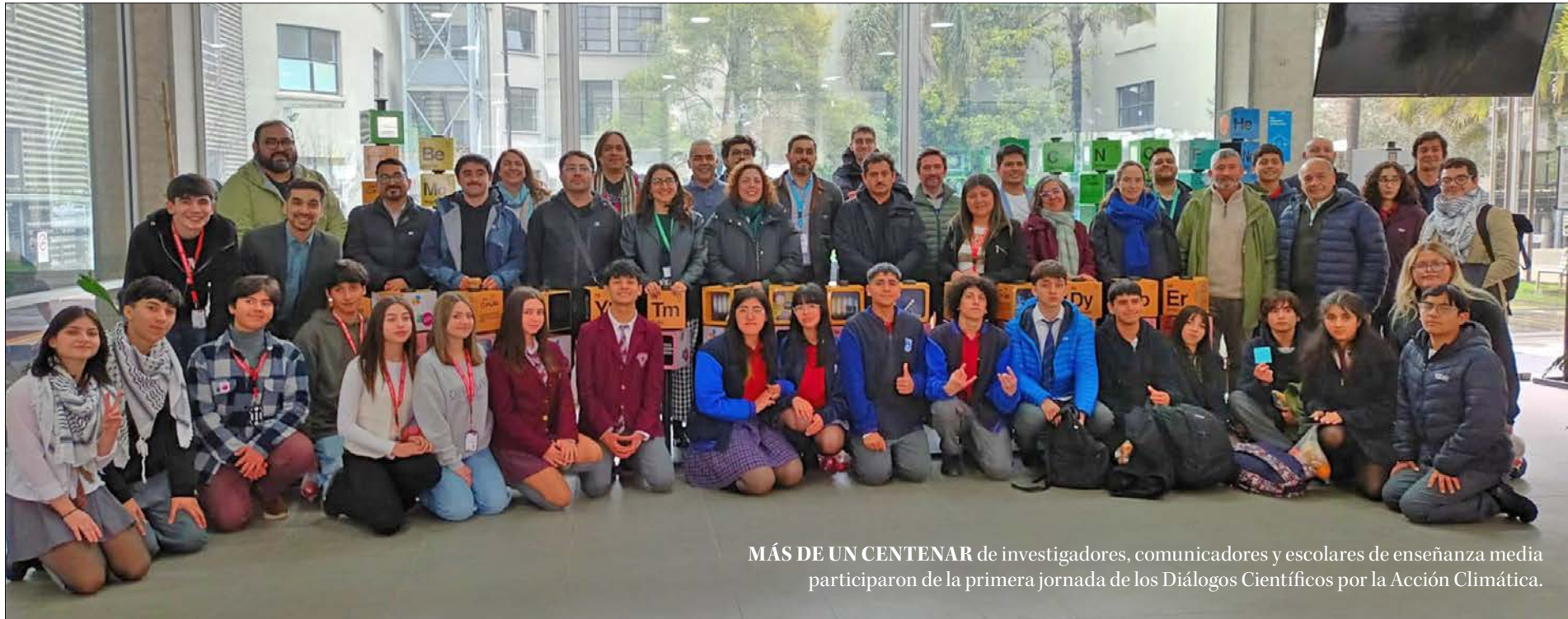
MÁS DE UN CENTENAR de investigadores, comunicadores y escolares de enseñanza media participaron de la primera jornada de los Diálogos Científicos por la Acción Climática.

Por Natalia Quiero Sanz natalia.quiero@diarioconcepcion.cl