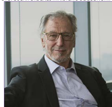
MINISTERIO DE ECONOMIA

Analizan el escenario que deberá gestionar nuevo ministro Álvaro García