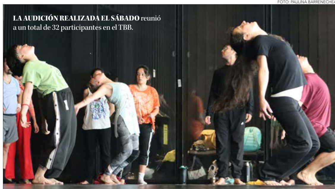
LA AUDICIÓN REALIZADA EL SÁBADO reunió a un total de 32 participantes en el TBB.

Programa que desembocará en el remontaje de la obra "Happyland", de la compañía Escénica en Movimiento estrenada en junio del año