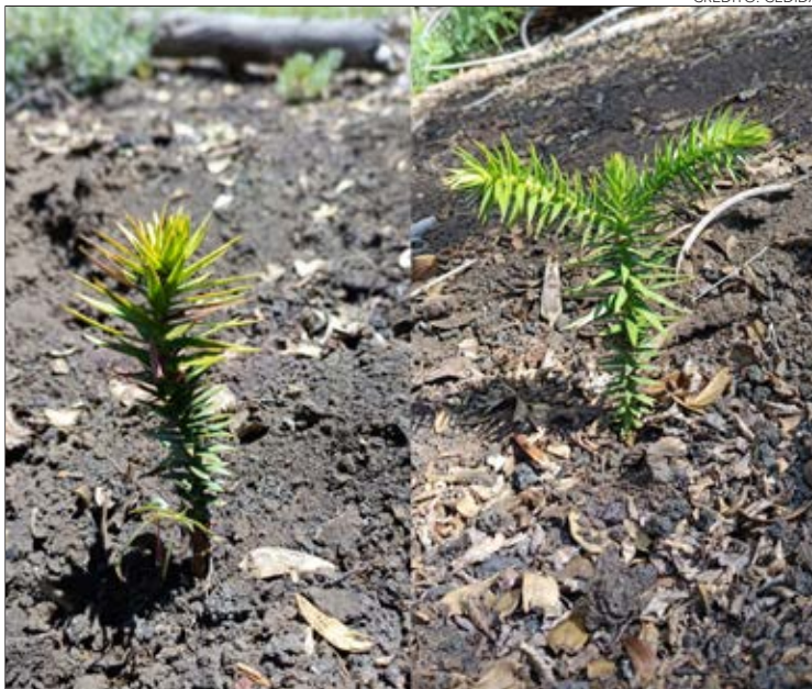
PLANTA CONTROL (IZQUIERDA) y planta con consorcio de hongos (HMA y HE) establecidas en terreno.

ción o sin afectación, las plantas inoculadas responden de una mejor forma, por lo que eso es una variable que considerar para los programas orientados a la reforestación, sobre todo con esta especie emblemática para el país, en los que se debe considerar este componente biológico asociado a estas plantas", manifestó.