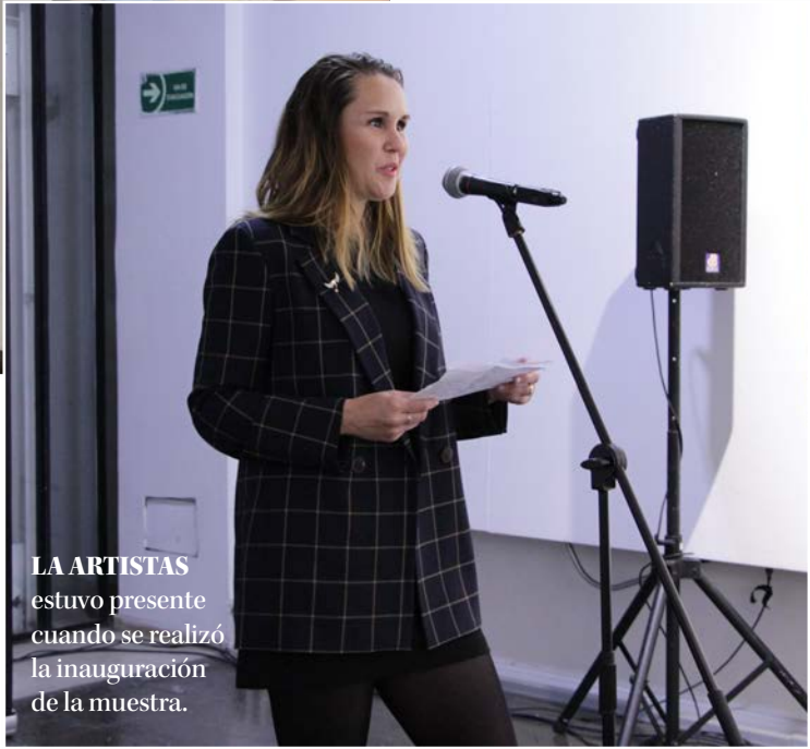
LA ARTISTAS estuvo presente cuando se realizó la inauguración de la muestra.