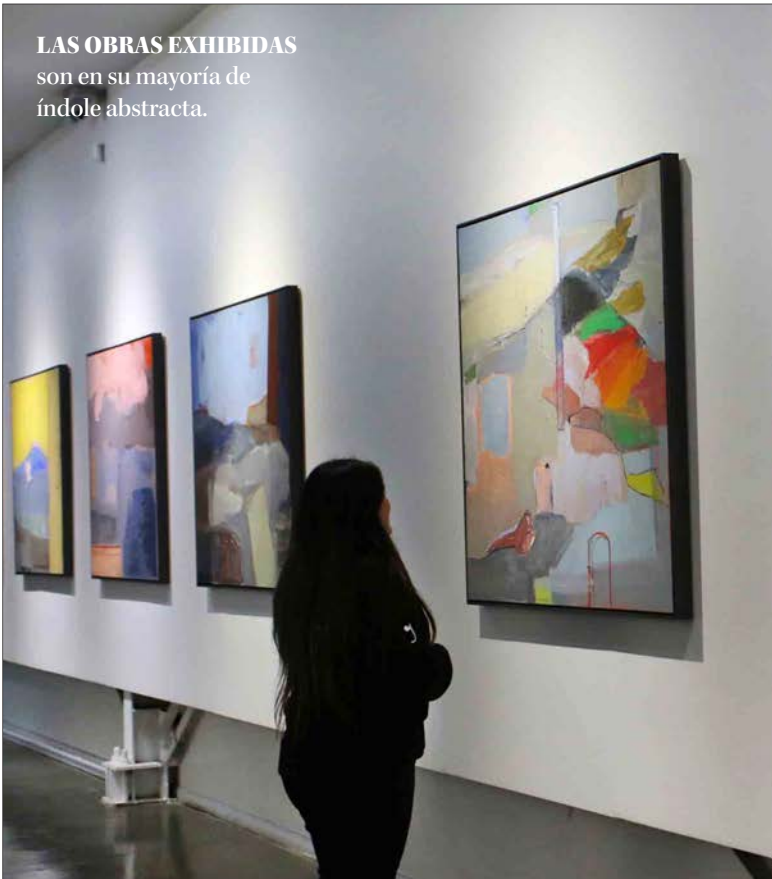
LAS OBRAS EXHIBIDAS son en su mayoría de índole abstracta.

La muestra, configurada en torno a 18 cuadros, refleja la evolución y madurez del trabajo de esta creadora plástica local, con dos décadas de trayectoria.