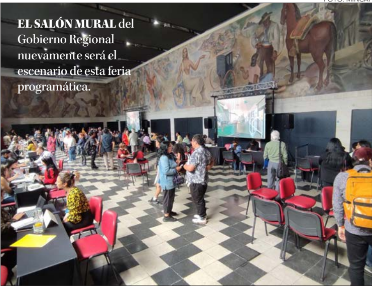
EL SALÓN MURAL del Gobierno Regional nuevamente será el escenario de esta feria programática.