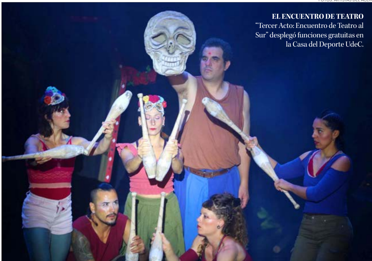
EL ENCUENTRO DE TEATRO “Tercer Acto: Encuentro de Teatro al Sur” desplegó funciones gratuitas en la Casa del Deporte UdeC.