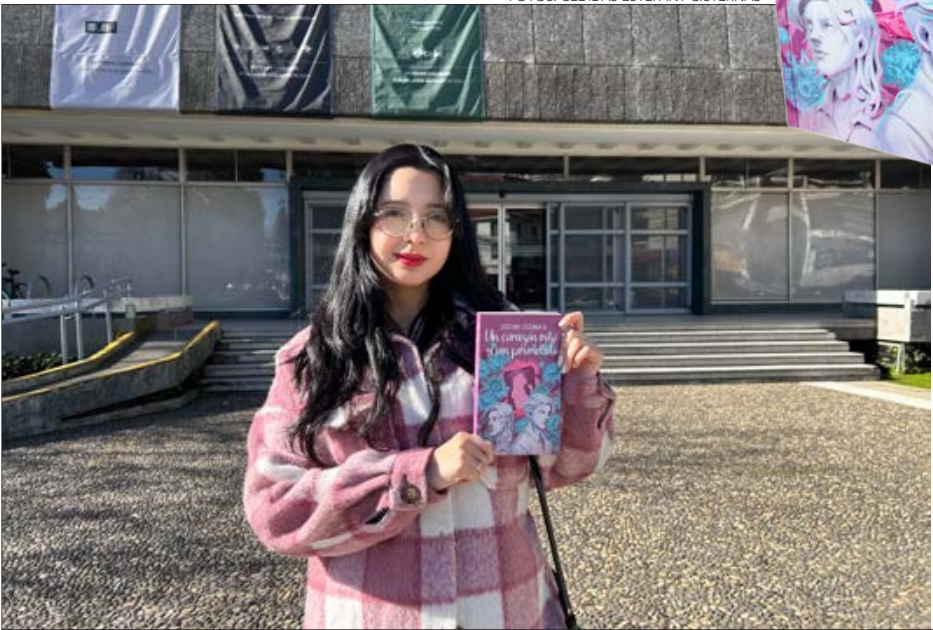
CISTERNAS, que también es periodista, proyecta seguir publicando nuevas historias con Concepción como escenario.

no solo reforzó la conexión de la novela con el público, sino que también impulsó su viralización y creciente interés en redes sociales como TikTok, lle-