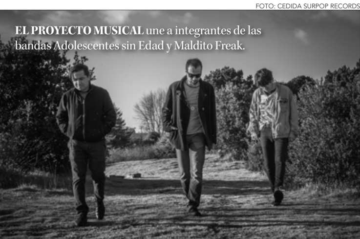
EL PROYECTO MUSICAL une a integrantes de las bandas Adolescentes sin Edad y Maldito Freak.

OPINIONES Twitter @DiarioConce contacto@diarioconcepcion.cl