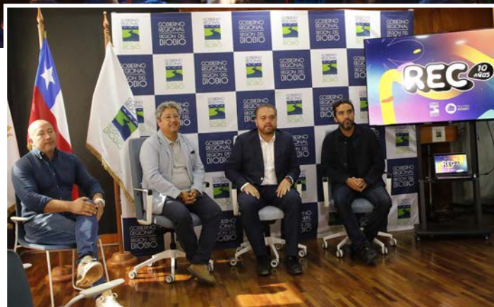
LAS PRINCIPALES autoridades del festival se reunieron la jornada de ayer para dar a conocer los detalles de los horarios de cada jornada.

Respecto a los espacios destinados a los auspiciadores, agregó que