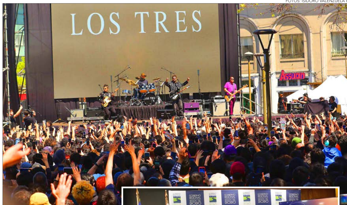
LA BANDA PENQUISTA Los Tres serán los encargados de cerrar la jornada del sábado 15 de marzo del escenario Entel.

El evento que se realizará el 15 y 16 de marzo, reveló el día de ayer detalles del timing de su programación para la versión de sus 10 años. Organización destacó mejoras de sus cuatro escenarios, con la idea de optimizar experiencia del público.