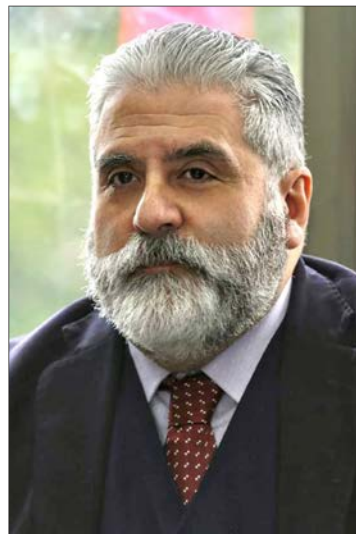
HUGO CAUTIVO , seremi de Obras Públicas.

- ¿Cómo ha funcionado el trabajo de privados en la conservación de la Ruta de la Madera?