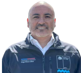
JORGE DAZA LOBOS Subsecretario de Transportes

El próximo 15 de enero, en las regiones de Tarapacá y de Aysén, comienza el periodo de implementación gradual de la licencia de conducir digital en Chile, proceso que concluirá en septiembre, una vez que este nuevo documento esté habilitado en el 100% de los municipios del país. Este avance tecnológico es un hito fundamental para introducir una nueva generación de políticas públicas que permitan brindar mayor seguridad pública y vial, y reducir la siniestralidad en el tránsito, salvando cientos de vidas cada año.