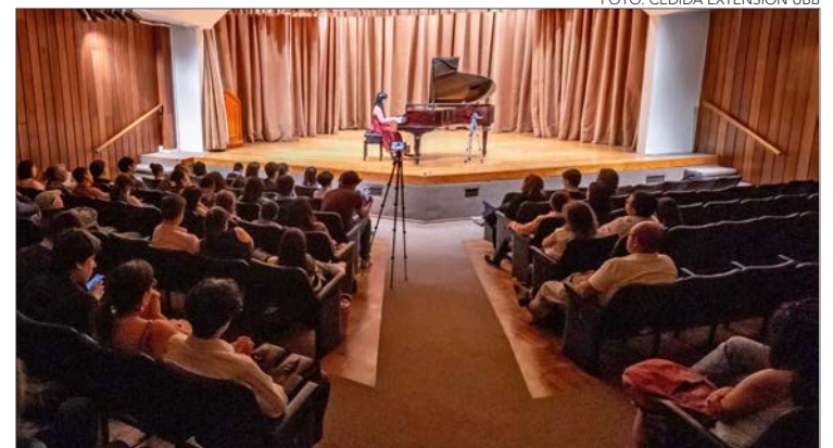
HACE UNOS DÍAS ATRÁS estudiantes del Conservatorio Laurencia Contreras también se presentaron en la sala del Colegio Médico penquista.

Laurencia Contreras es la primera de las actividades de celebración, por los 85 años de esta institución musical dependiente de la UBB, y