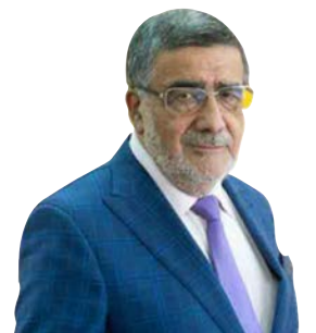
PEDRO VERA CASTILLO Delegado Junta Nacional PDC

fundo error – rápidamente se convirtió en el líder político más importante de la oposición a Pinochet, respaldado además por líderes y gobiernos extranjeros.