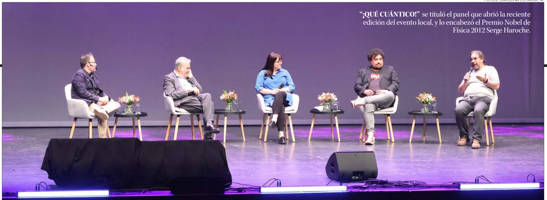
“¿QUÉ CUÁNTICO?” se tituló el panel que abrió la reciente edición del evento local, y lo encabezó el Premio Nobel de Física 2012 Serge Haroche.

El Congreso Futuro Biobío 2025 realizó dos paneles encabezados por un exponente internacional junto a especialistas de las universidades del Cruch Biobío-Ñuble, quienes compartieron investigaciones, opiniones y reflexiones en torno al tema en cuestión. Al cierre se contestaron preguntas del público.