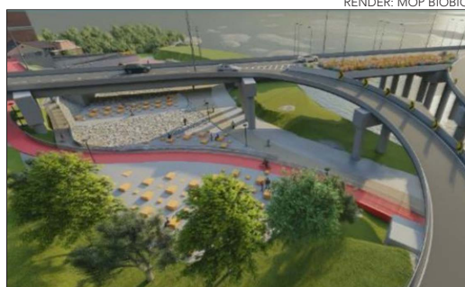
RENDER: MOP BIOBÍO

Aumento de gastos y estrechez presupuestaria provocan retraso en pavimentación de Parque Industrial de Coronel