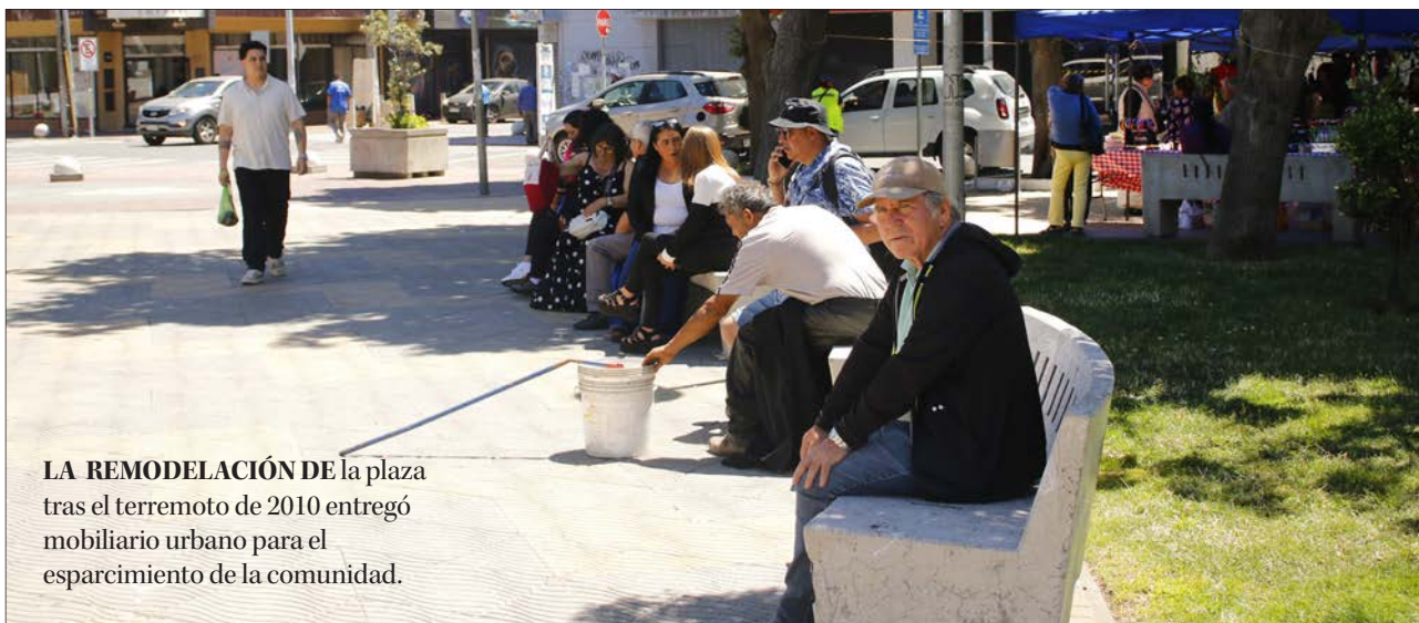
LA REMODELACIÓN DE la plaza tras el terremoto de 2010 entregó mobiliario urbano para el esparcimiento de la comunidad.

Cuenta con 4 mil 700 metros cuadrados pavimentados, áreas verdes, fuentes de agua, mesas de ajedrez, baños públicos, un odéon y la tradicional Parroquia San José, que si bien sufrió daños producto del terremoto y posterior tsunami fue recuperada gracias al aporte del arzobispado, municipio y Consejo Nacional de la Cultura y Las Artes.