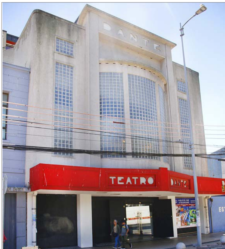
EL TEATRO DANTE , ubicado a un costado de la Plaza de Armas, fue construido en 1940 y funcionó hasta 1980. Luego tras una serie de proyectos de reconstrucción volvió a abrir sus puertas en 2018.