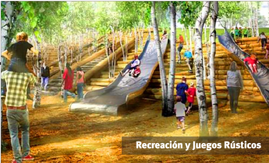
Recreación y Juegos Rústicos