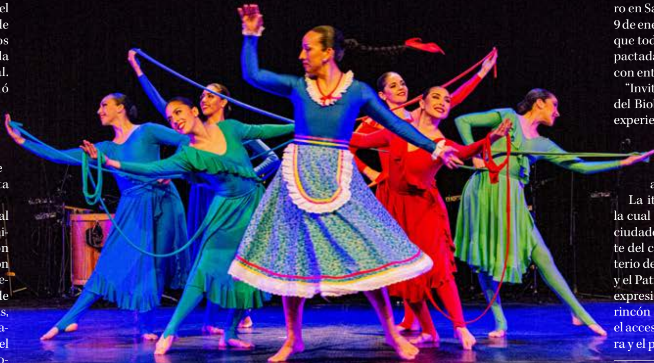
LA PROPUESTA DEL Bafona incluye diversos bailes y que representan la identidad de diversos territorios de nuestro país.

La itinerancia del Bafona, la cual también visitará otras ciudades del país, forma parte del compromiso del Ministerio de las Culturas, las Artes y el Patrimonio de acercar las expresiones culturales a cada rincón del país, promoviendo el acceso equitativo a la cultura y el patrimonio vivo.