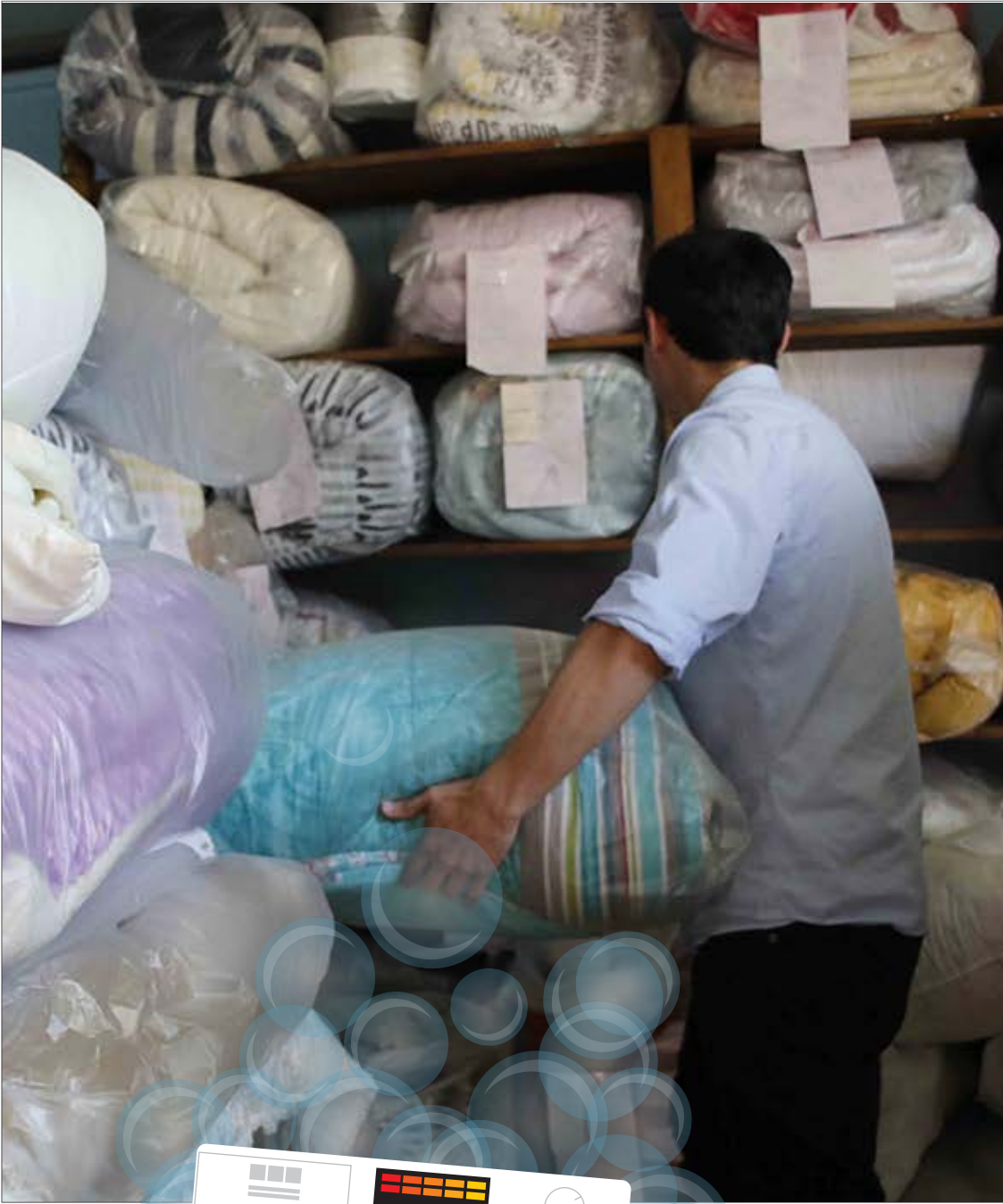
ILUSTRACIÓN: ANDRÉS OREÑA P.