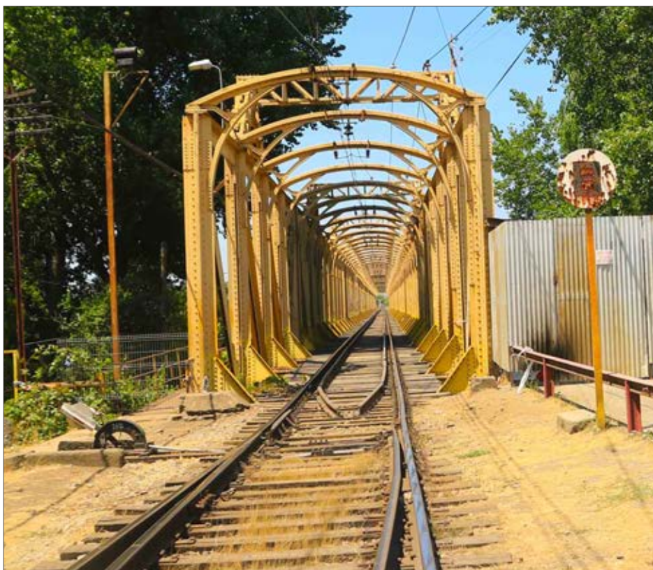
SAN ROSENDO y Laja, son parte de las comunas que incluirá el estudio que busca habilitar el nuevo servicio de tren de pasajeros.

OPINIONES Twitter @DiarioConce contacto@diarioconcepcion.cl