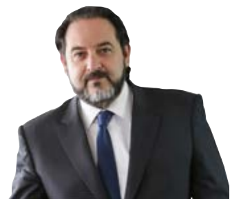
ANDRÉS REBOLLEDO SMITMANS Secretario Ejecutivo de la Organización Latinoamericana de Energía, OLADE

quén, en Argentina este año, el que promueve el intercambio de recursos energéticos a través del Gasoducto del Pacífico y del oleoducto Trasandino, lo que demuestra el potencial de esta integración, específicamente con el gas natural y crudo del yacimiento Vaca Muerta.